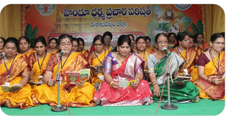
తిరుమల తిరుపతి దేవస్థానం పర్యవేక్షణలో హిందూ ధర్మ ప్రచార పరిషత్ ఆధ్వర్యంలో స్థానిక రుషికొండ శ్రీ వేంకటేశ్వర ఆలయంలో విష్ణు సహస్రనామాలు, లలితా సహస్రనామాన్ని అలా పిలుస్తున్న మహిళలు

నడుస్తుంది. రామేశ్వరం--సికింద్రాబాద్ (07686) ప్రత్యేకరైలు మార్చి 24, 31, ఏప్రిల్ 7, 14, 21, 28, మే 5, 12, 29, 26, జూన్ నెలలో 2, 9, 16, 23, 30, జూలై 7, 14, 21, 28 తేదీలలో నడుస్తుందని తెలిపారు. వెంటింగ్ లిస్ట్ ప్రయాణికుల రద్దీని తగ్గించే చర్యల్లో భాగంగా గుంటూరు-విశాఖపట్నం మధ్య సడీచే సింహద్రి ఎక్స్ప్రెస్ రైలుకు తాత్కాలికంగా అదనపు ఏసీ చైర్ కార్ కోచ్ను జత చేసి నడపనున్నట్లు దక్షిణ మధ్య రైల్వే అధికారులు ప్రకటించారు. గుంటూరు - విశాఖపట్నం (17239/17240) రైలు ఈ నెల 19 నుంచి ఏప్రిల్ 2 వరకు అదనపు ఏసీ కోచ్తో నడపనున్నట్లు తెలిపారు.