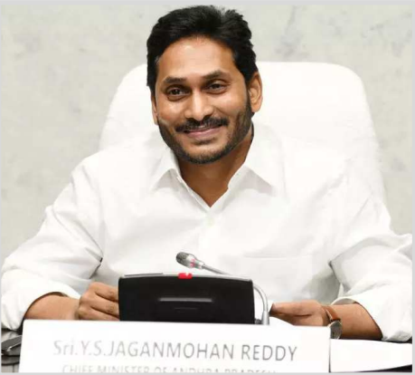
గ్రూప్-2 లో డిప్యూటీ తహసీల్దార్లు, సబ్ రిజిస్ట్రార్లు, మున్సిపల్ కమిషనర్లు, ట్రెజరీ అధికారులు తదితర ఖాళీల భర్తీకి సీఎం వైఎస్ జగన్ అనుమతి ఇచ్చారు.

అమరావతి: గ్రూప్ పోస్టుల భర్తీకి ఆంధ్రప్రదేశ్ లో గ్రీన్ సిగ్నల్ లభించింది. జాబ్ క్యాలండర్ పోస్టులకంటే అదనంగా భర్తీకి అనుమతి ఇచ్చారు ముఖ్యమంత్రి వైఎస్ జగన్మోహన్ రెడ్డి. దీంతో గ్రూప్ 1, గ్రూప్ 2 పోస్టుల భర్తీకి మార్గం సుగమమైంది. గ్రూప్ 1 కేటగిరీ కింద 110 పోస్టులు, గ్రూప్-2 కేటగిరీ కింద 182 పోస్టులకు అనుమతి లభించింది. దీంతో ఏపీపీఎస్సీ త్వరలో నోటిఫికేషన్లు జారీ చేయనుంది. డిప్యూటీ కలెక్టర్లు, ఆర్డీవో, సీటీవో, డివిస్సి, డి ఎఫ్ ఓ, మున్సిపల్ కమిషనర్, ఎంపిడివో పోస్టుల భర్తీకి, ఇక