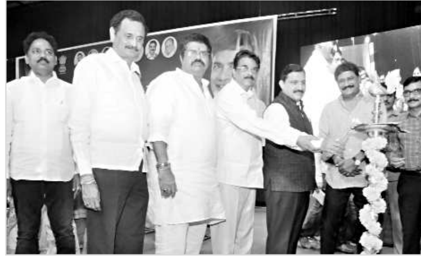
విశాఖపట్నం: కేంద్రం ప్రవేశపెట్టిన వస్తు, సేవల పన్ను విధానం దేశ ఆర్థిక సమగ్రాభివృద్ధికి ఉత్తమ చోడకమని, దాన్ని

కేంద్ర సైన్సు, టెక్నాలజీ శాఖ సహాయ మంత్రి వై.ఎస్.చౌదరి