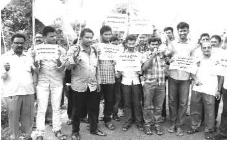
తెలియజేయాలన్నారు. 9వ తేదీన జరిగి జె.టి పరీక్షనైనా సరకు మంత్రిని పంపించాలని...