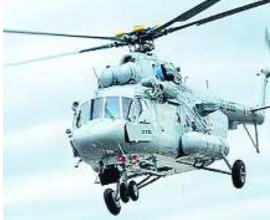
జాకోవ్ స్కీ(రష్యా): ఎంబ-17 మిలటరీ రవాణా హెలికాప్టర్ల కొనుగోలు ఒప్పందానికి సంబంధించి భారత్ అందజేసింది. 2012-13లో మరో 71 చాప్టర్ల కొనుగోలు మూడు అదనపు ఒప్పందాలు కుదుర్చుకుంది.

చర్చలు జరుపుతున్నట్లు రష్యా ఉన్నతాధికారి ఒకరు వెల్లడించారు. ఈ ఏడాది చివరినాటికి 48 ఎంబ-17 చాప్టర్ల కొనుగోలు ఒప్పందం పూర్తవుతుందని తెలిపారు. ఎంబ-8, ఎంబ-17 మోడల్స్ కు చెందిన 300కు పైగా మిలటరీ హెలికాప్టర్ల భారత్ వద్ద ఉన్నాయని, మరో 48 ఎంబ-17 హెలికాప్టర్ల కొనుగోలు రష్యాతో భారత్ చర్చలు జరుపుతోందని రోసాబోరాన్ ఎక్స్ ప్రెస్స్ సీఈఓ అలెగ్జాండర్ మైఖేవ్ తెలిపారు. 2008లో 80 ఎంబ-17 చాప్టర్లను భారత్ కు విక్రయం చేయడం ఒప్పందం కుదుర్చుకున్న రోసాబోరాన్ ఎక్స్ ప్రెస్స్.. 2011-13లో వాటిని అందజేసింది. 2012-13లో మరో 71 చాప్టర్ల కొనుగోలు మూడు అదనపు ఒప్పందాలు కుదుర్చుకుంది.