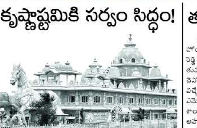
కృష్ణాప్రమికి సర్వం సిద్ధం!

లాలూకు నితీశ్ మరో షాక్! పాట్నా: ఆర్థికి రాంరాం చెప్పి బీజేపీతో చేతులు కలిపి మళ్ళీ సీఎం అయిన నితీశ్.. 48 గంటల్లోనే లాలూకు మరో షాక్ ఇచ్చారు. ఇసుక మాఫియాపై ఉక్కుపాదం మోపాలని పోలీసులకు ఆదేశాలు జారీ చేశారు. రాష్ట్రానికి వెయ్యి కోట్ల ఆదాయం తెచ్చిపెట్టే ఇసుక దందాలో.. ఎక్కడ తరువాయి 2లో