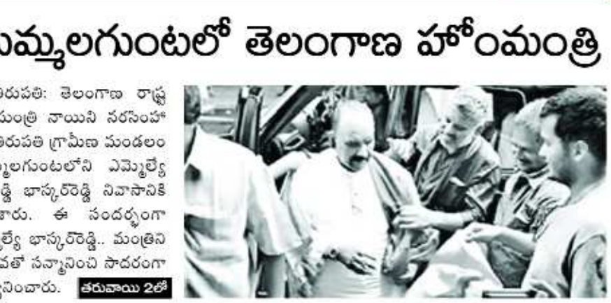
తుమ్మలగుంటలో తెలంగాణ హోంమంత్రి