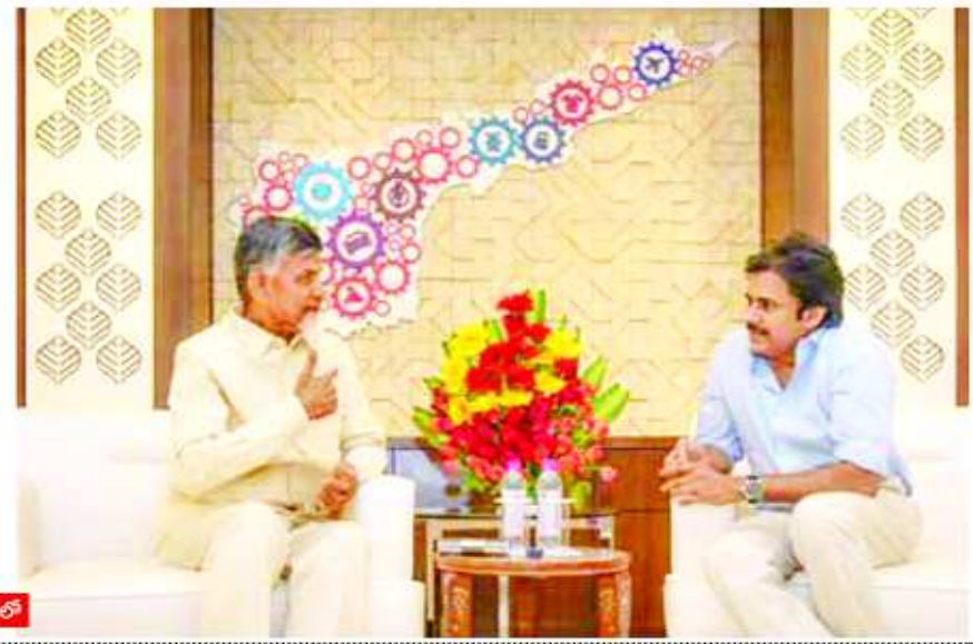
పవన్ చొరవ ముదావహం: సీఎం ఉద్ధానం కిచ్చి సమస్య పరిష్కారానికి జనసేన అధినేత పవన్ తరువాయి 2లో

అమరావతి: ఏపీ ముఖ్యమంత్రి చంద్రబాబుతో జనసేన అధినేత పవన్ కల్యాణ్ ఏకాంత భేటీ ముగిసింది. ఈ ఏకాంత భేటీలో ఉద్ధానం కిచ్చి వ్యాధిగ్రస్తల సమస్యలతో పాటు, పోలవరం, రాజధాని నిర్మాణం, మంజూరణ కమిషన్ నివేదిక అంశాలు చర్చకు వచ్చినట్లు తెలుస్తోంది. అంతేకాకుండా రాష్ట్రంలోని తాజా రాజకీయ పరిణామాలపైనూ వీరిద్దరూ చర్చించినట్లు సమాచారం. అమరావతి నిర్మాణానికి ఈ మూడేళ్లలో తీసుకున్న చర్యలను సీఎం చంద్రబాబు... పవన్కు వివరించినట్లు సమాచారం. కాస్త రిజర్వేషన్లపై చర్చలు ముగ్యం చేసిన విషయాన్ని ఆయన దృష్టికి తీసుకొచ్చినట్లు తెలుస్తోంది.