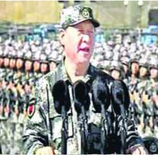
జిన్ పింగ్... సైనికులను ఉద్దేశించి ప్రసంగిస్తూ 'సీపీసీ నాయకత్వం ఇచ్చే ఆదేశాలను మీరు విధిగా పాటించాలి. పార్టీ ఏం చెబితే అది చేయాలి. మనపైకి వచ్చే శత్రువు లండరీని ఓడించగలమనే విశ్వాసం, సామర్థ్యం మన ఆర్యకీ ఉంది' అని అన్నారు.

బీజింగ్: చైనా శత్రుదుర్భేధమైన దేశమని అధ్యక్షుడు జీ జిన్ పింగ్ ధీమా వ్యక్తం చేశారు. తమపై యుద్ధానికి వచ్చే ప్రపంచంలోని ఏ దేశాన్నినా ఓడించే సామర్థ్యం తమ ఆర్యకీ ఉందని అన్నారు. చైనా సైన్యం యుద్ధానికి సన్నద్ధంగా ఉండటాన్ని ఆయన ప్రశంసించారు. 23 లక్షల మంది సైనికులను కలిగిన చైనా పీపుల్స్ లిబరేషన్ ఆర్మీ (పీఎల్ఎ) ప్రపంచంలోనే అతిపెద్దది. 1927 ఆగస్టు 1న మావో జైడాంగ్ నేతృత్వంలోని చైనా కమ్యూనిస్టు పార్టీ(సీపీసీ) పీఎల్ఎను స్థాపించింది. అప్పటి నుంచి పీఎల్ఎ చైనా ప్రభుత్వం కింద కాకుండా సీపీసీ ఆధ్వర్యంలోనే పనిచేస్తోంది. తాజాగా పీఎల్ఎ 90వ వార్షికోత్సవం సందర్భంగా మంగోలియాలోని ఝులిహోలో భారీ పరేడ్, ఆయుధాల ప్రదర్శనను నిర్వహించారు. ఈ ప్రదర్శనను జిన్ పింగ్ లీలకించారు. 12 వేల దశాగా, 100కు పైగా యుద్ధ విమానాలు, 600 రకాల ఆయుధాలను ప్రదర్శించారు. వీటిలో సగం ఆయుధాలు కొత్తగా రూపొందించినవే. స్వల్ప, మధ్య, దీర్ఘదూర లక్ష్యాను ఛేదించగల ఐదు అణు, సంప్రదాయ క్షిపణులతోపాటు భారత సరిహద్దులో పరిక్షించారని చెబుతున్న కొత్త యుద్ధ ట్యాంకును కూడా ఈ ప్రదర్శనలో ఉంచారు. ఇంకా బలమైన ఆర్య అవసరం.. సీపీసీ కేంద్ర కమిటీ ప్రధాన కార్యదర్శి కూడా ఆయన