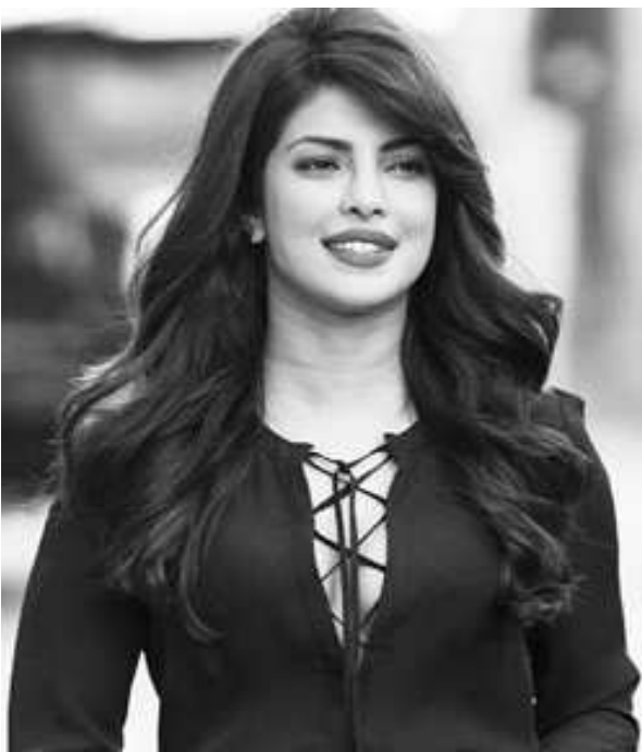
టీవీ సిరీస్కు నిర్మాతగా మారడం ప్రాధాన్యతను సంతరించుకుంది. వచ్చే ఏడాది ద్వితీయార్థం నుంచి ఈ సిరీస్ను ప్రారంభించడానికి సన్నాహాలు చేస్తున్నారు.