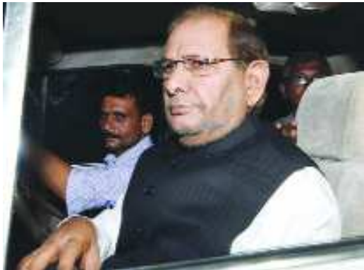
దీంతో రాజీనామా చేసిన 24 గంటల్లోనే బీజేపీ మద్దతుతో మళ్ళీ అధికారాన్ని దక్కించుకున్నారని నితీష్ కుమార్. శాసనసభలో బలాన్ని నిరూపించుకుని మరోసారి సీఎం అయ్యారు.

న్యూఢిల్లీ: భారతీయ జనతా పార్టీతో జేడీయూ పాత్రపెట్టుకుని బీహార్ లో ప్రభుత్వాన్ని ఏర్పాటు చేయడంపై ఇంతవరకు మౌనంగా ఉన్న ఆ పార్టీ సహ వ్యవస్థాపకులు శరద్ యాదవ్ ఎట్టకేలకు స్పందించారు. మహాకూటమి నుంచి వె%దాలిగి బీజేపీతో పాత్రపెట్టుకున్న జేడీయూ అధినేత, బీహార్ ముఖ్యమంత్రి నితీష్ కుమార్ నిర్ణయాల్పై గత కొన్ని రోజులుగా శరద్ యాదవ్ మౌనంగా ఉన్న విషయం తెలిసింది. సోమవారం రాజ్యసభ సమావేశాలకు హాజరయ్యేందుకు వచ్చిన శరద్ యాదవ్ బీహార్ రాజకీయాలపై మీడియాతో మాట్లాడారు. బీహార్ లో ఇటీవల జరిగిన పరిణామాలు దురదృష్టకరం. వాటిని నేను అంగీకరించబోను. రాష్ట్ర ప్రజలకు కావాల్సింది ఇది కాదు' అని అన్నారు. కాగా, రెండేళ్ల మహాకూటమికి గుడ్ బై చెప్పి.. నితీష్ గతవారం బీజేపీతో పాత్రపెట్టుకున్న విషయం తెలిసింది.