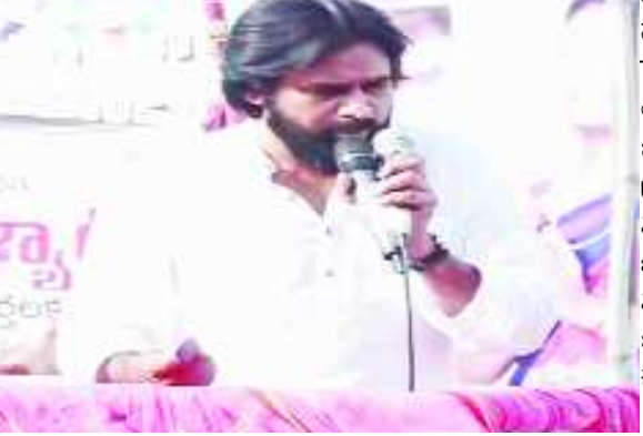
హైదరాబాద్: తెలంగాణలో డిసెంబర్ 7న జరగబోయే ముందస్తు ఎన్నికల్లో పోటీ చేసే అంశంపై జనసేన కసరత్తు ప్రారంభించింది. ఏపీలో పక్కటకలతో బిజిబిజిగా గడుపుతున్న తరవాయి 2లో..

ముందస్తు ఎన్నికలపై జనసేన కసరత్తు .. 16న టీ-నేతలతో సమావేశం!