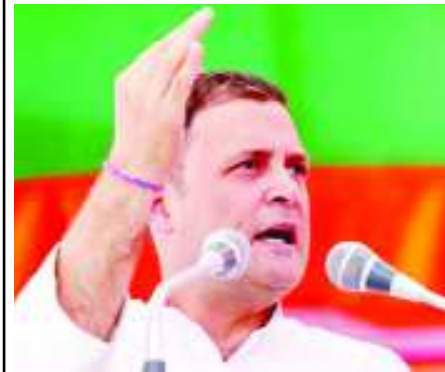
జైపూర్: రాఫెల్ వివాదం నుంచి గుజరాత్ సామూహిక వలసల వరకూ వివిధ అంశాలపై ప్రధాని మోదీ తీరును కాంగ్రెస్ అధ్యక్షుడు రాహుల్ గాంధీ ఎండగట్టారు. రాఫెల్

ఒప్పందాన్ని హిందుస్థాన్ ఏరోనాటిక్ లిమిటెడ్ (హెచ్ఎఎల్) నుంచి లాక్సుని అనిల్ అంబానీకి ఇచ్చారంటూ తప్పుపట్టారు. రాజస్థాన్లోని ధోల్పూర్లో మంగళవారం నిర్వహించిన బహిరంగ సభలో రాహుల్ మాట్లాడుతూ, రూ.45,000 కోట్ల మేరకు బకాయిలు ఉన్న అనిల్ అంబానీకి 'హాల్' నుంచి గుంజుకున్న రాఫెల్ ఒప్పందాన్ని మోదీ కట్టబెట్టారని చెప్పారు. ఇదే విషయాన్ని తాను పార్లమెంటులో ప్రశ్నించినప్పుడు మోదీ తన కళ్లలో కళ్లు పెట్టి చూడలేకపోయారని అన్నారు. ఒక్క రాఫెల్ యుద్ధ విమానం ధరను రూ.526 కోట్ల నుంచి రూ.1,600 కోట్లకు ప్రధాని పెంచేశారని ఆరోపించారు. రాఫెల్ ఒప్పందం ఖరారుకు ప్రధాని స్వయంగా అంబానీని తరవాయి 2లో..