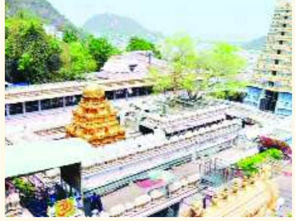
విజయవాడ : బుధవారం నుంచి కనకదుర్గమ్మ దేవస్థానంలో దసరా ఉత్సవాలు ప్రారంభం కానున్నాయి. ఈ నెల 14న మూలా నక్షత్రంలో సరస్వతీదేవి ఆవతారంలో కనక తరవాయి 2లో..