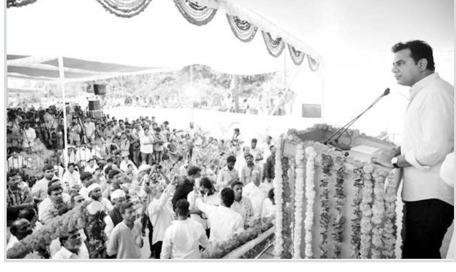
నవంబర్ చివరికల్లా 30 కిలోమీటర్ల మెట్రో రైల్ నవంబర్ చివర్లో నుంచి మియాపూర్ వరకు 30 కిలోమీటర్ల మేర మెట్రో తరువాయి 2లో

హైదరాబాద్ : రాష్ట్ర ప్రభుత్వానిది అభివృద్ధి బాట అని పట్టణాభివృద్ధి, ఐటీ, పరిశ్రమల శాఖల మంత్రి కే తారక రామారావు చెప్పారు. ఇప్పటిదాకా ప్రభుత్వంచేసిన కృషితో సంకల్పచెందడం లేదని, ఇది ఆరంభం మాత్రమేనని అన్నారు. హైదరాబాద్ మహా నగరాభివృద్ధి సంస్థ (హెచ్ఎండిసి) రూ.387కోట్లతో ఆరు లేన్లతో నిర్మించవలసిన బాలానగర్ భాగ్నోడ్ల ఓవర్ నిర్మాణ పనులకు మంత్రి కేటీఆర్ శంకుస్థాపన చేశారు. ఈ సందర్భంగా ఏర్పాటుచేసిన సభలో మాట్లాడుతూ, రాబోయే ఏడెనిమిదేండ్లలో హైదరాబాద్ను విశ్వనగరంగా తీర్చిదిద్దాలన్నామన్నారు. కేవలం రోడ్లు, ప్లా ఓవర్లు, జంక్షన్ల అభివృద్ధికి రూ.3వేల కోట్లతో పనులు చేపడుతున్నామని చెప్పారు. మెట్రోగేజి క్రెడిట్ వ్యవస్థతో సం 11వేల కోట్లతో ప్రతిపాదనలు రూపొందించామన్నారు. రూ.2వేల కోట్లతో శివారు మున్సిపాలిటీల్లో ఇంటింటికీ నీళ్లు అందించే ప్రయత్నం చేశామని చెప్పారు. కచ్చితంగా మెట్రో రెండోడోడో, హైదరాబాద్ నగరంలో స్ట్రావేలకు సీఎం కేసీఆర్ సారథ్యంలోనే శ్రీకారం చుడుతామని ప్రకటించారు. ఈ ప్రభుత్వంలో పేదలకు అందుతున్న ఫలాలు ఆరంభం మాత్రమేనని, సీఎం కేసీఆర్ మనసులో చాలా ఆలోచనలున్నాయని కేటీఆర్ చెప్పారు. కేసీఆర్ కార్యదక్షతతో హైదరాబాద్ అభివృద్ధికి అన్ని విధాలా కృషిచేస్తున్నామని అన్నారు.