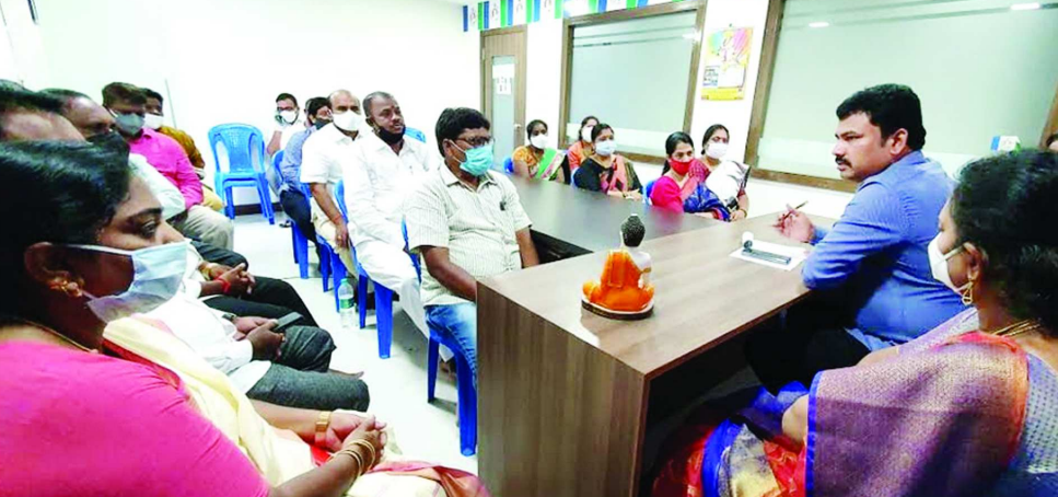
కార్యక్రమంలో వార్డు కార్పొరేటర్ అభ్యర్థులు , వార్డు అధ్యక్షులు, అనుబంధ సంఘాల ప్రతినిధులు, సీనియర్ నాయకులు పాల్గొన్నారు.