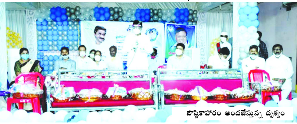
పోషణకార్యక్రమం అందజేస్తున్న దుకాణం