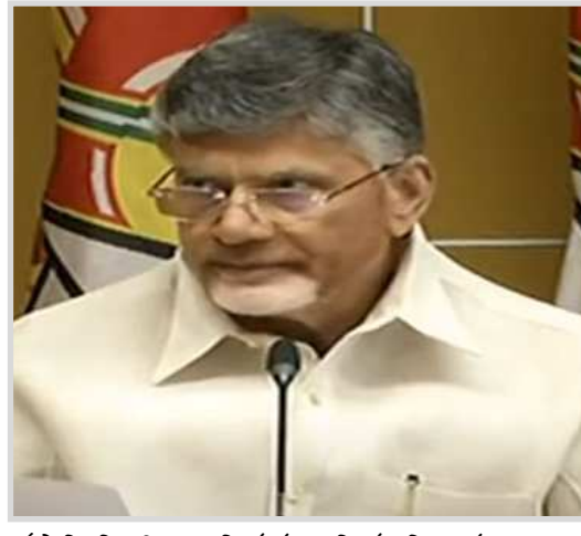
నష్టాన్ని నివారించాలని ప్రభుత్వాన్ని సూచించారు.

అమరావతి: గులాబ్ తుపాను ప్రభావంతో ఇబ్బందులు పడుతున్న ప్రజలకు తెలుగుదేశం పార్టీ నాయకులు, శ్రేణులు, కార్యకర్తలు తమ వంతు సాయం అందజేయాలని ఆ పార్టీ అధినేత చంద్రబాబు విలుపునిచ్చారు. ప్రజలకు అవసరమైన నిత్యావసర సరకులతో పాటు లోతట్టు ప్రాంతాల్లో ఉన్న వారిని సురక్షిత ప్రదేశాలకు తరలించడంలో సహాయం అందించాలన్నారు. బాధితులకు తెదేపా శ్రేణులు అన్ని విధాలా అండగా నిలవాలని సూచించారు. తుపాను ప్రభావంపై ప్రభుత్వం ఎప్పటికప్పుడు అప్రమత్తంగా ఉండాలని అవసరం ఉందని స్పష్టం చేశారు. విజయనగరం, శ్రీకాకుళం, విశాఖపట్నం జిల్లాల్లో లోతట్టు ప్రాంతాల ప్రజల అవసరాలను తీర్చేవిధంగా అన్ని చర్యలు తీసుకోవాలన్నారు. విద్యుత్ సరఫరాకు ఆటంకం కలుగుకుండా అప్రమత్తంగా ఉండాలని.. ముందస్తు చర్యలు చేపట్టి