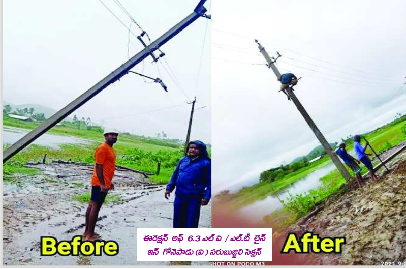
Before After ఈ రోజున లోత 6.3 ఎల్ ఓ / ఎల్.టి లైన్ ఓన్ గోసెపాడు (బి) సరుక్కుల్లి నిక్షేపణ

విశాఖపట్నం : 'గులాబ్ తుపాన్ ప్రభావంతో' దెబ్బతిన్న విద్యుత్తు సరఫరా వ్యవస్థను యుద్ధప్రాతిపదికన పునరుద్ధరించామని ఈపీడీసీఎల్ సి ఎండి కె. సంతోషరావు పేర్కొన్నారు. సంస్థ సిబ్బంది రేయింబవళ్ళు కష్టపడి అతి తక్కువ సమయంలో పునరుద్ధరించగలిగారన్నారు. ముఖ్య మంత్రివర్గం వై.ఎస్. జగన్మోహన్ రెడ్డి, ఇంధనశాఖ మంత్రివర్గం బాలినేని శ్రీనివాసరెడ్డి, ఇంధనశాఖ కార్యదర్శి ఎన్.శ్రీకాంత్ ఆదేశాలమేరకు ఎప్పటికప్పుడు అధికారులతో సమీక్షలు నిర్వహిస్తూ పునరుద్ధరణ చర్యలు త్వరితగతిన పూర్తి చేసామన్నారు. వర్షాల కారణంగా ఏపీఈపీడీసీఎల్ పరిధిలోని 5 జిల్లాల్లో 103 మండలాల్లో 3821 గ్రామాల్లో 13,70,415