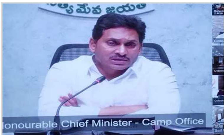
శ్రీకాకుళం : నదీ పరీవాహక ప్రాంత ప్రజలను పునరావాస కేంద్రాలకు తరలించాలని రాష్ట్ర ముఖ్యమంత్రి వై.ఎస్.జగన్ మోహన్ రెడ్డి ఆదేశించారు.

శ్రీకాకుళం : నదీ పరీవాహక ప్రాంత ప్రజలను పునరావాస కేంద్రాలకు తరలించాలని రాష్ట్ర ముఖ్యమంత్రి వై.ఎస్.జగన్ మోహన్ రెడ్డి ఆదేశించారు. ఒడిషాలో కురుస్తున్న వర్షాలు కారణంగా నదీ పరీవాహక ప్రాంతాలు వరదలకు గురి అయ్యే అవకాశాలు ఉన్నాయని ఆయన తెలిపారు. జిల్లా కలెక్టర్లతో రాష్ట్ర ముఖ్యమంత్రి సోమ వారం వీడియో కాన్ఫరెన్స్ నిర్వహించారు. గులాబ్ తుఫాన్ ప్రభావం ఏ మేరకు ఉందో అడిగి తెలుసుకున్నారు. విద్యుత్ పునరుద్ధరణ తక్షణం చర్యలు తీసుకోవాలని ఆయన ఆదేశించారు. కుటుంబాలకు మానవతాధిక్కారంతో వ్యవహరించాలన్నారు. నాణ్యమైన ఆహారాన్ని అందించాలని ఆయన ఆదేశించారు. లోతట్టు ప్రాంతాల నుంచి నీటిని పంపింగ్ చేయాలని ఆయన సూచించారు. వరదలకు, తుఫాను కు గురైన కుటుంబాలకు ఆవసరం మేరకు వెయ్యి రూపాయల వరకు ఆర్థిక సహాయం అందించుటలో వెనుకంజ వేయరాదని ముఖ్య మంత్రి ఆదేశించారు. వైద్య శిబిరాలను ఏర్పాటు చేయాలని ఆయన ఆన్వయించారు. సమైక్య ఆంధ్రా వేయాలని ఆయన చెప్పారు. అక్కక్కడ వరదలను ఆలోచించాలని, మానవ తప్పిదం ఎక్కడా