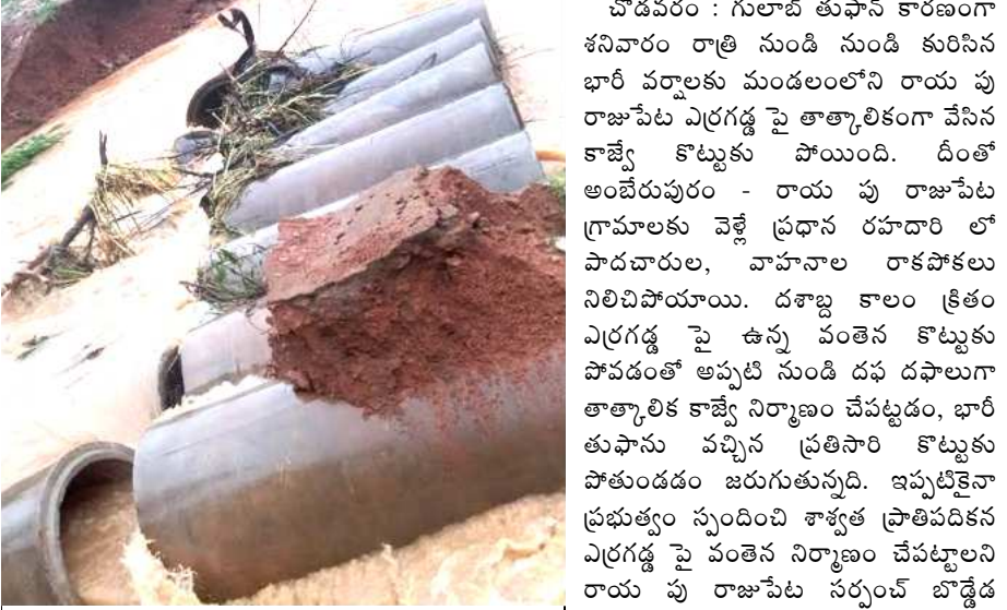
భారీ వర్షాలకు కొట్టుకుపోయిన రాయపురాజుపేట కాజీవే