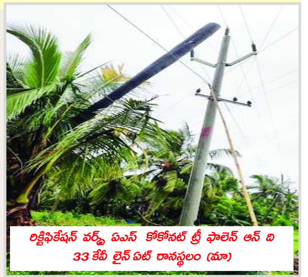
లక్ష్మీనికేషన్ వర్క్ ఓఎస్ కోకోనట్ ట్రీ ఫాలిన్ ఆన్ బి 33 కేబి లైన్ ఓల్డ్ రాస్వలం (మా)

నట్లు వెల్లడించారు. మిగిలిన వాటిని సోమవారం రాత్రికి పూర్తి స్థాయిలో విద్యుత్తు సరఫరాను పునరుద్ధరించేలా చర్యలు చేపట్టాలని ఎన్.ఈ.లకు ఆదేశాలిచ్చామని సిఎండి వివరించారు. వర్షాల ప్రభావంతో తెగిపడిన విద్యుత్ వైర్లు, పడి పోయిన విద్యుత్ స్తంభాలు, పాడైపోయిన ట్రాన్సఫార్మర్ల పట్ల వినియోగదారులు జాగ్రత్తగా వ్యవహరించాలని, విద్యుత్తు అంతరాయాలు వాటికి సంబంధించిన సమాచారాన్ని టోల్ ఫ్రీ నెం. 1912కు, కంట్రోలు రూమ్ ఫోన్ నెంబరు - కార్పొరేట్ ఆఫీసు 9440816373, 8331018762, సిజీఎం ఆపరేషన్స్ 9440812567, జీఎం కాల్ సెంటర్ 9440814206, శ్రీకాకుళం 9490612633, పాలకొండ 7386764579, డెక్కలి 6305107900, విజయనగరం 9490610102, బొబ్బిలి 9492666989 / 9490610121, పార్వతీపురం 9440814205, విశాఖపట్నం 7382299975, అనకాపల్లి 9885262424, నర్సపట్నం 9491030714, పాడేరు 9490610026, సంబంధిత సెక్షన్స్ కార్యాలయాలకు తెలియజేయవచ్చన్నారు.