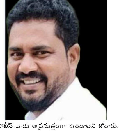
పోలీస్ వారు అప్రమత్తంగా ఉండాలని కోరారు.