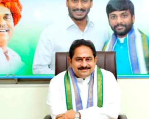
పరవాడ : ఎలక్షన్ కాటింగ్ ఎప్పుడు వచ్చిన వైసీపీ గెలుపు తధ్యమనీ వైసీపీసెంట్రల్ ఎగ్జిక్యూటివ్ మెంబర్