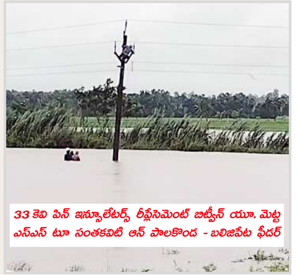
33 కెబి ఎన్ జమ్మలెట్టర్, రీఫ్లెక్టింగ్ జిప్సీస్ యూ. మెట్ల ఎస్ఎస్ టూ సంకఠవిధి ఆన్ పాలకొండ - బలిజపేట ఫీడర్