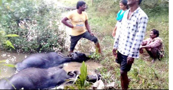
సుమారు లక్ష రూపాయల విలువైన దున్నలు కళ్ళముందే చనిపోవడంతో ఆ కుటుంబం బోరున విలపించారు.