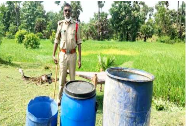
స్వాధీనం చేసుకున్న పులుపు