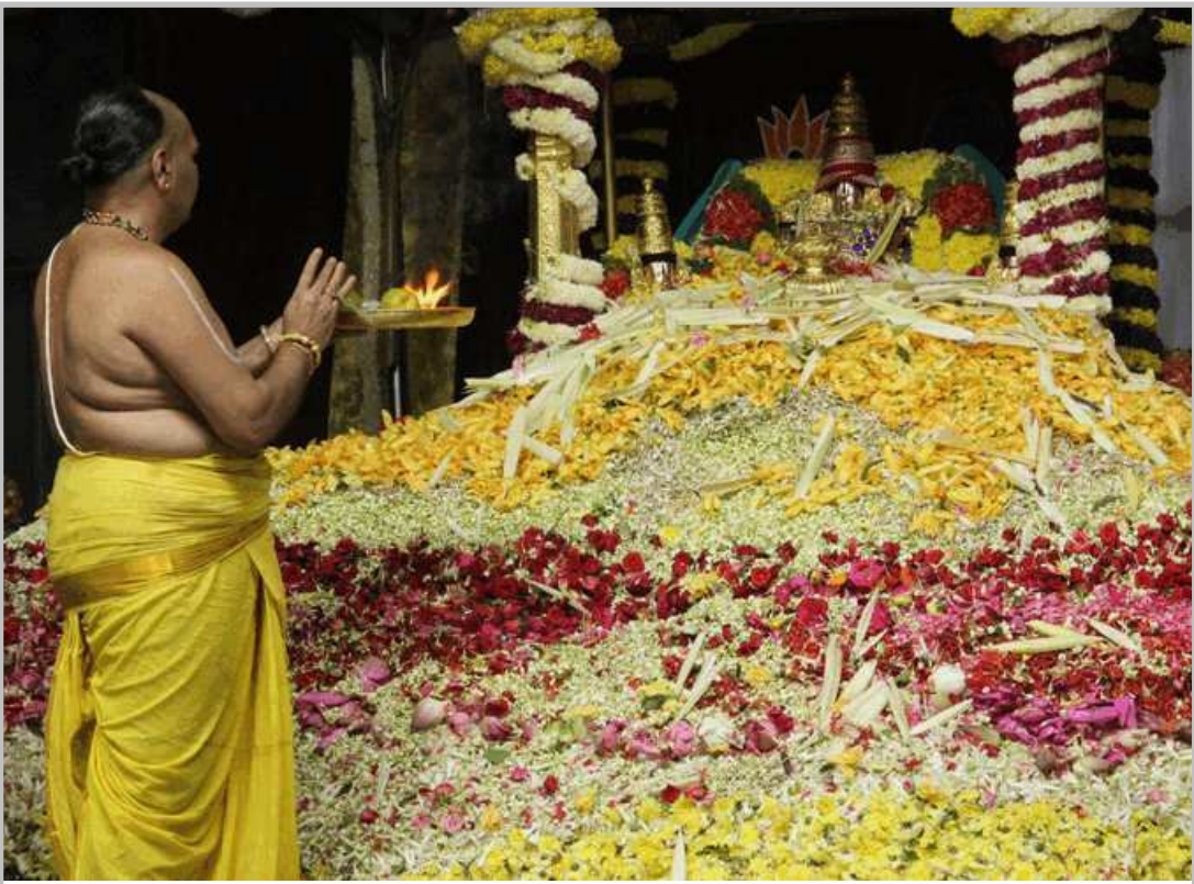
కార్తీక మాసంలో శ్రవణ నక్షత్రాన్ని పురస్కరించుకొని తిరుమల శ్రీవారి ఆలయంలో గురువారం పుష్పయాగ మహోత్సవం వైభవంగా నిర్వహించారు. సువాసనలు వెదజల్లే 14 రకాల పుష్పాలు, 6 రకాల పత్రాలతో శ్రీదేవి, భూదేవి సమేత మలయపుస్తామివారికి వేడుకగా పుష్పార్చన నిర్వహించారు. రంగురంగుల పుష్పాలు, పత్రాల మధ్య స్వామి, అమ్మవార్ల వైభవం మరింత ఇనుమడించింది.

గత రెండు శతాబ్దాలలో పాశ్చాత్య విద్యాంసుల ఆధిక్యత మన విజ్ఞాన విద్యారంగాలలో విరివిగా కొనసాగినది. ఆ ప్రభావం నేటికీ కొనసాగుతూనే ఉంది. విదేశీ పరిపాలనలో, సంస్కృతి విజ్ఞానరంగాలలో కొన్ని నియంతృత్వ ధోరణులు అమలైనవి. దివ్య జ్ఞాన సమాజానికి చెందిన మేడం బ్లావెటిస్కో, అని బిసెంటు, మిస్టర్ జడ్జిలాంటి వారు తమకు విశ్వాంతరాళాల నుంచి కుతుమి, మోర్యాననే (బౌద్ధ) దివ్యాత్మల నుంచి దివ్య సందేశాలు వస్తుంటాయని చెబితే, నిజమే కాబోలుననుకొని విశ్వసించినవారు అనేకులున్నారు. తుదకు అదంతా బూటకమని కీ.శ్రీ.జిడ్డు కృష్ణమూర్తిగారు ఖండించిన విషయం సువిదితాంశమే. బ్రిటిషు హయాంలో ఇలాంటి ఉదంతాలు అనేకం జరిగినవి.