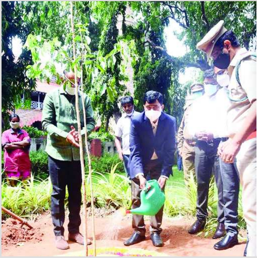
పకృతి పరిరక్షణలో భాగంగా విశాఖపట్నం జిల్లా కలెక్టరేట్ ప్రాంగణం లో మొక్కను నాటుతున్న జిల్లా కలెక్టర్ డా.ఎ.మల్లికార్జున