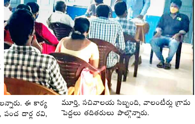
ముగ్గురి, సచివాలయ నిబ్బంది, వాలంటీర్ల గ్రామ పెద్దలు తదితరులు పాల్గొన్నారు.