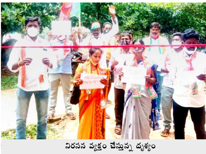
నిరసన వ్యక్తం చేస్తున్న దృశ్యం