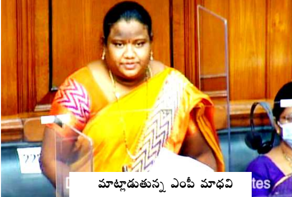
మాట్లాడుతున్న ఎంపీ మాధవి

కొయ్యూరు : గిరిజన ప్రాంతాల్లో ప్రధాన మంత్రి ఆవాస యోజన పథకం కింద నిర్మిస్తున్న ఇళ్లకు లక్ష ఎన్నై వేల నుంచి మూడు లక్షలకు పెంచాలని పార్లమెంట్ లో అరకు ఎంపీ గణేటి మాధవి తనవైన శైలిలో తన వాణిని వినిపించారు. ప్రస్తుతం కేంద్ర ప్రభుత్వం ప్రధాన మంత్రి ఆవాస యోజన పథకం కింద ఇళ్ల నిర్మాణాల కొరకు కేటాయిస్తున్న నిధులు 1,80,000 రూపాయలు కానీ మా గిరిజన ప్రాంతాల్లో ఇళ్ల నిర్మించుకుంటున్న గిరిజన ప్రజలకు అన్ని ఖర్చులు కలుపుకుంటే, ఒక ఇల్లు నిర్మాణానికి సుమారు మూడు లక్షల రూపాయలు వరకు ఖర్చు అవుతుందన్నారు. దీనిని కేంద్ర ప్రభుత్వం ఎన్ని సబ్ ప్లాన్ కింద తీసుకుని ప్రస్తుతం 1,80,000 నుండి మూడు లక్షల రూపాయలకు పెంచాలని కేంద్ర హౌసింగ్ మినిస్టర్ ను కోరారు.