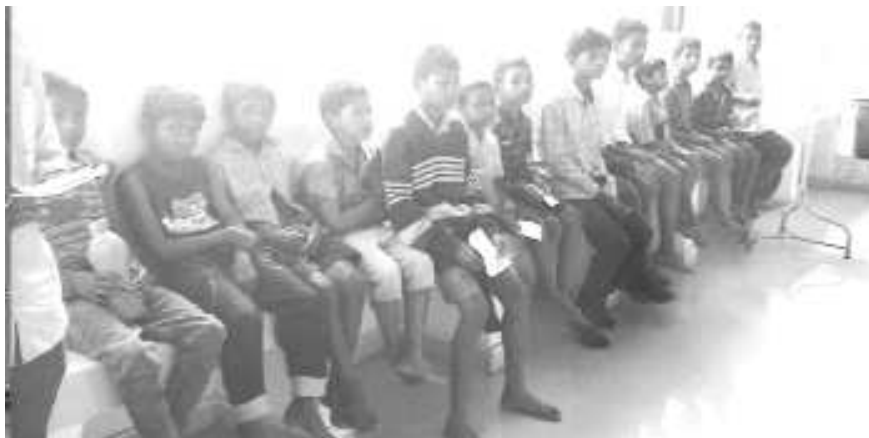
నాతవరం పిహెచ్ఎస్ కి వచ్చిన రామన్నపాలెం వసతి గృహ విద్యార్థులు

నాతవరం : నాతవరం మండలం రామన్నపాలెం బాలర వసతి గృహ విద్యార్థులకు జ్యూరాలు వ్యాపించడంతో వారంతా బుధవారం నాతవరం పిహెచ్ఎస్ కి వచ్చారు.