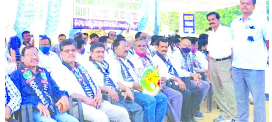
గాజువాక : విశాఖ స్టీల్ ప్లాంట్ ప్రైవేటీకరణపై కేంద్ర ప్రభుత్వం తీసుకున్న నిర్ణయాన్ని వ్యతిరేకిస్తూ ఉక్కు కార్మికులు గాజువాక నియోజకవర్గ పరిధిలోని స్టీల్ ప్లాంట్ ప్రధాన ద్వారం వద్ద గత 18 రోజులుగా నిరాహారదీక్షలు చేపడుతున్నారు. విశాఖ ఉక్కు పరిరక్షణ పోరాట సమితి అధ్యక్షులలో సిఓసీసీ కార్మికులు మద్దతు పలుకుతూ బుధవారం సంఘీభావం