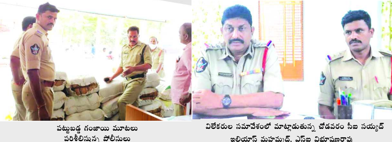
పట్టుబడ్డ గంజాయి మూటలు పరిశీలిస్తున్న పోలీసులు