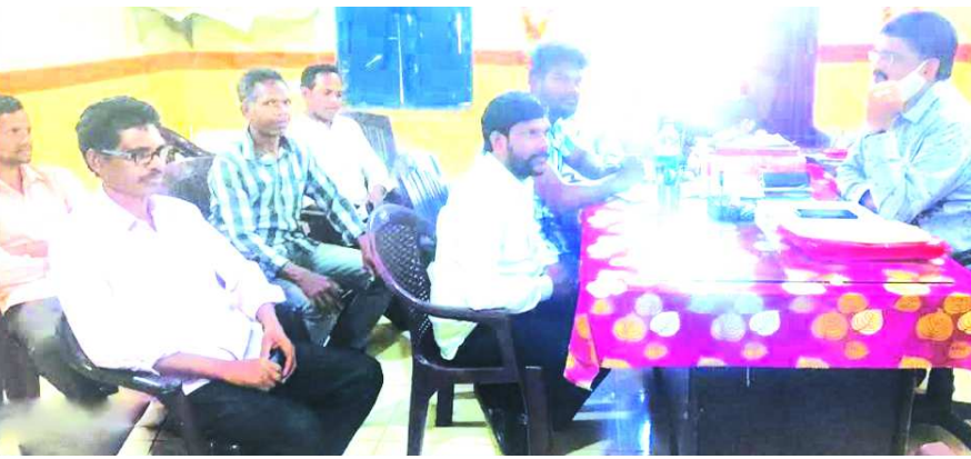
పాడేరు : ముంచినగిట్లపూ మండలం, దారెల పంచాయతీ సర్పంచ్ ముంచినగిట్లపూ మండల ఎంపీడిహో గారిని మర్యాదపూర్వకంగా కలిసి పంచాయతీలో నెలకొన్న సమస్యలను చర్చించారు. ముందుగా ఎన్ని గ్రామాలలో మంచినగిట్ల అందించే విధంగా చర్యలు తీసుకోవాలని, పంచాయతీలో వాటర్ ట్యాంకులు రీపేర్స్ వివరీతంగా వున్నాయని, డింబుగూడ గ్రామంలో