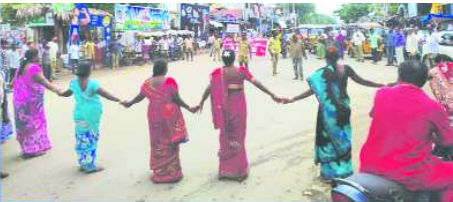
కోత్తూరు జంక్షన్ వద్ద మానవహారం చేస్తున్న చోడవరం పంచాయతీ కాంట్రాక్టు కార్మికులు

చోడవరం : చోడవరం పంచాయతీలో కాంట్రాక్టు కార్మికులుగా పనిచేస్తున్న పారిశుద్ధ్య కార్మికులు, డ్రైవర్లు, ఎలక్ట్రిషియన్ల పెండింగ్లో ఉన్న వేతనాలు వెంటనే చెల్లించాలంటూ కోత్తూరు జంక్షన్లో మంగళవారం ఉదయం మానవహారం నిర్వహించారు. కార్మికుల సమస్యలపై గత 5 రోజులుగా పంచాయతీ కార్యాలయం వద్ద నిరసన కార్య