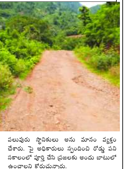
పలువురు స్థానికులు ఆసు మానం వ్యక్తం చేశారు. పై అధికారులు స్పందించి రోడ్డు పని సకాలంలో పూర్తి చేసి ప్రజలకు అందు బాటులో ఉంచాలని కోరుతున్నారు.

ఆనంతగిరి : ఆనంతగిరి మండలంలో పెద బిడ్డ గ్రామపంచాయితీ పరిధిలోగల బొడ్డుగడ్డ జంక్షన్ నుండి వయా చెరుకుమడత, పెదబిడ్డ పంచాయితీ రోడ్డు నరకప్రాయంగా ఉందని ఆ రోడ్డులో ప్రయాణం చేయాలంటేనే నరకవేతన పడుతున్నామని స్థానికులు వాపోతున్నారు. రోడ్డుకి అనుకోని సుమారుగా 30 గ్రామాలు న్నాయని ఆరోగ్య సమస్యలు తలెత్తిస్తున్నారని రోగులకు వాహనాల మీద చికిత్సానిమిత్తం ఆసుపత్రిలో తీసుకెళ్లటము జరుగుతుందని ఆ సందర్భాల్లో రోడ్డు గుంతలు ఏర్పడి ఉండడంతో సకాలంలో చికిత్స అందటం లేదని అలాగే గర్భిణులు, బాలింతలకు అయితే వాహనాలలో తీసుకెళ్లలేక నానా అవాస్తవ పడుతు న్నామని వారు అన్నారు. అంతేకాకుండా గర్భిణీలు అయితే మార్గమధ్యలోనే ప్రసవాల జరిగి వైద్యం అందక మరణించే ప్రమాదం ఉందని ఆందోళన వ్యక్తం చేశారు. ఇంజనీరింగ్ అధి కారులు నిర్లక్ష్యం వలనే పనుల్లో జాప్యం జరుగు తోందని