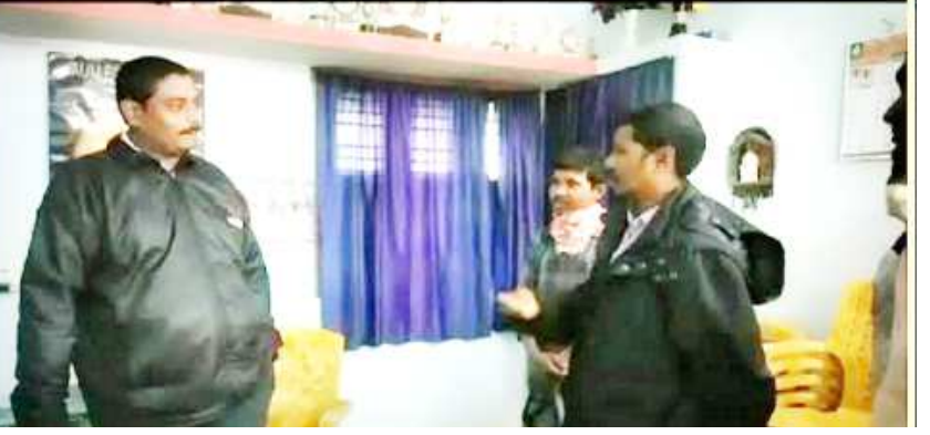
ప్రెసిడెంట్ వివరణ : పాఠశాల నిర్వహణ, సిబ్బంది జీతాలు ఎక్కడ నుంచి ఇవ్వాలి..? బివిఎస్ విద్యార్థుల తల్లిదండ్రులు ఇష్టపూర్వకంగా నే వ్రాసి ఇచ్చి ఫీజులు కడుతున్నారని, మేము ఎవ్వరి వద్ద బలవంతంగా గుంజు కోవడం లేదని అన్నారు.. తల్లిదండ్రులు చెప్పేది వాస్తవం కాదా..? అని మీడియా ప్రశ్నిస్తే.. వారికి పని పాటు లేక మీ ముందు అలా మాట్లాడుతూ న్యూస్ అన్నారు. అయితే, గుమస్తా సొమ్ముతా మీకే జమ చేస్తున్నానని చెప్పాడుగా దానికి మీరు ఏమంటారని అడిగితే నాకు ఈ విషయం తెలియనే తెలియదని, గుమస్తా అక్రమాలకు పాల్పడినట్లు మీరు చెప్పితే గానీ నాకు తెలియదని వివరణ ఇచ్చారు. ఇలా ఇద్దరు ప్రెసిడెంట్, గుమస్తా) సొంతం లేని మాటలతో మీడియాకే బుర్రీ కొట్టిస్తూ అక్రమ ఫీజు వసూలుకు పాల్పడుతున్నారని చెప్పారు. ఆ పాఠశాల యజమాన్యం పై కఠినంగా శిక్షించాలని విద్యార్థుల తల్లిదండ్రులు డిమాండ్ చేస్తున్నారు.