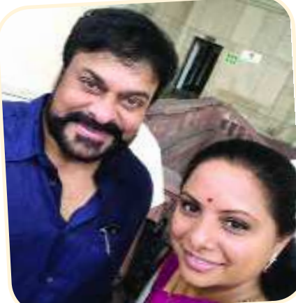
న్యూఢిల్లీ: ఉపరాష్ట్రపతి ఎన్నికల నేపథ్యంలో పార్లమెంట్ ఆవరణమంతా సందడిగా కనిపించింది. ఉల్లాసభరితంగా ఆహ్లాదకరంగా దర్శనం ఇచ్చింది. శనివారం పోలింగ్ నేపథ్యంలో ఓటు వేసేందుకు ఢిల్లీకి వచ్చిన తెలుగు ప్రాంతాల

ఎంపీలు మరింత ఆకర్షణీయంగా కనిపించారు. తమ ఓటు హక్కును వినియోగించుకున్న అనంతరం ఒకరినొకరు సరదాగా పలకరించుకున్నారు. వీరిలో ముఖ్యంగా టీఆర్ఎస్ పార్టీ కల్యాణకుంట్ల కవిత మరింత ఆకట్టుకున్నారు. తనకు ఎదురైన ప్రతి ఒక్కరిని అస్పృశ్యంగా పలకరించి నమస్కారాలు చేస్తూ ముందుకు వెళ్లిన ఆమె కాంగ్రెస్ పార్టీ ఎంపీ, ప్రముఖ నటుడు చిరంజీవితో సరదాగా కనిపించారు. ఆయనతో కలిసి సెల్ఫీ దిగారు. కవితతోపాటు ఇతర ఎంపీలు కూడా చిరునావలతో సెల్ఫీలు దిగారు. ఓటింగ్ అనంతరం టీఆర్ఎస్ ఎంపీలు మీడియాతో మాట్లాడుతూ తమ పార్టీ అధినేత కేసీఆర్ ఆదేశాల ప్రకారం బీజేపీ అభ్యర్థి వెంకయ్యనాయుడితో తాము ఓటు వేచామని చెప్పారు. ఇక ఎంపీ కవిత చిరంజీవితో కలిసి దిగిన సెల్ఫీని ట్విట్టర్ లో పోస్ట్ చేస్తూ ఫ్యాన్ మూవెంట్ విత్ మొగాస్టార్ అంటూ ట్విట్ చేశారు.