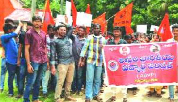
ఆందోళన చేస్తున్న విద్యార్థులు