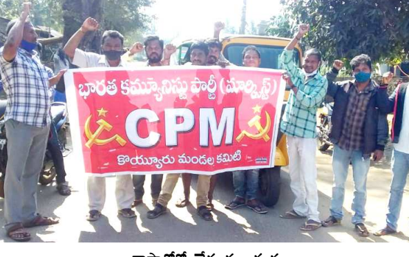
రాస్తారోకో చేస్తున్న దృశ్యం