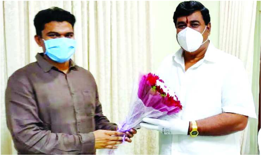
విశాఖ సిటీ సర్క్యూట్ గెన్డ్ హౌస్కు చేరుకున్న ఉప ముఖ్యమంత్రి ధర్మాన కృష్ణదాస్కు స్వాగతం పలికిన జాయింట్ కలెక్టర్ అరుణ్బాబు, ఇతర విశాఖ జిల్లా రెవెన్యూ, స్టాంప్స్ అండ్ రిజిస్ట్రేషన్ అధికారులు