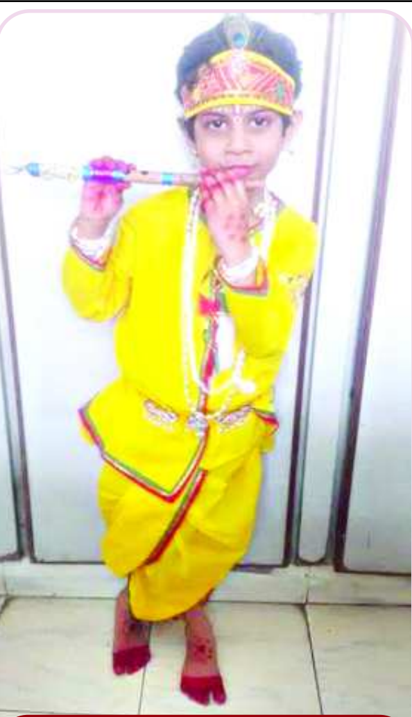
కృష్ణాష్టమి సందర్భంగా శ్రీ కృష్ణుని వేషధారణలో చిన్నారి బెందాళం విహారిక

కృష్ణాష్టమి సందర్భంగా గౌరవ వేషధారణలో చిన్నారి బెందాళం విహారిక (విశాఖ వ్యాల్ స్కూల్, యూకేజీ)