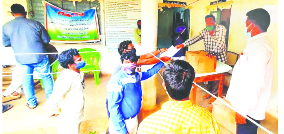
చిలకలగిడ్డ పంచాయతీ చిలకలగిడ్డ గ్రామంలో రైతు భరోసా సబ్ సెంటర్ ను అడ్డుకున్న గ్రామస్థులు