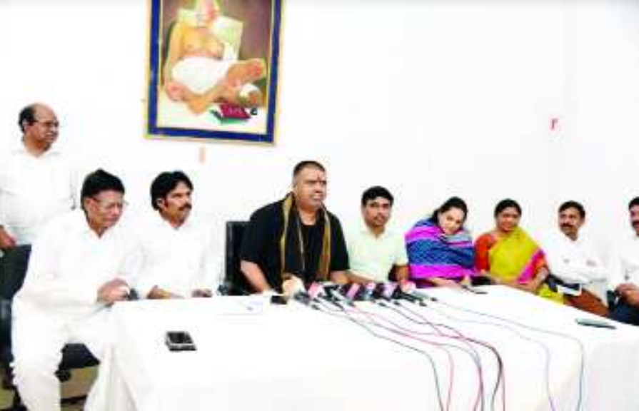
విశాఖపట్నం : దీపావళి పండుగ నాటికి జిల్లాలో ఇసుక కొరత లేకుండా చర్యలు తీసుకుంటున్నట్లు పర్యాటక శాఖ మంత్రి ముత్తంశెట్టి శ్రీనివాసరావు తెలిపారు.

పర్యాటక శాఖ మంత్రి ముత్తంశెట్టి శ్రీనివాసరావు