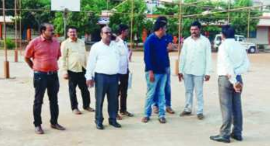
విశాఖపట్నం: గురువారం నుండి జిల్లాలో ఉన్న పాఠశాలల విద్యార్థులకు కంటి పరీక్షలు నిర్వహించడం జరుగుతుందని జిల్లా వైద్య ఆరోగ్యశాఖ అధికారి డా. ఎన్. తిరుపతి రావు తెలిపారు. బుధవారం తమ కార్యాలయంలో నిర్వహించిన పత్రికా విలేజరుల సమావేశంలో ఆయన మాట్లాడుతూ అక్టోబర్ 10 ప్రపంచ అంధత్వ నివారణ దినం నుండి ప్రారంభమయ్యే వైయస్సార్ కంటి వెలుగు లో భాగంగా మొదటి విడతగా 5 నుండి 10వ తరగతి విద్యార్థులకు పాఠశాలల్లోనే కంటి పరీక్షలు నిర్వహిస్తామన్నారు. 10వ తేదీన గాజువాక జెడ్ పి ఉన్నత పాఠశాల లో పర్యాటక శాఖ మంత్రి ముత్తంశెట్టి శ్రీనివాసరావు కార్యక్రమాన్ని ప్రారంభిస్తారని తెలిపారు.10 నుండి 16వ తేదీ వరకు కార్యక్రమం ఉంటుందన్నారు.

జిల్లాలోని 5,268 ప్రభుత్వ ప్రైవేటు పాఠశాలల్లో చదువుతున్న 6 లక్షల 16 వేల 166 మంది కు విద్యార్థులకు పరీక్షలు జరిపుతామని వెల్లడించారు. లోపాలను గుర్తించి, అవసరమైన వారికి ఉచితంగా కళ్ళజోళ్ళు, కంటి సమస్యలకు శస్త్రచికిత్సలు, వైద్య సహాయం అందిస్తామన్నారు. ఈ కార్యక్రమం నిర్వహించేందుకు 117 ఆసుపత్రులు, ప్రాథమిక వైద్య కేంద్రాల నుండి 146 వైద్య అధికారులు, 850 బృందాలను ఏర్పాటు చేశామన్నారు. వైద్య నిపుణుల తోపాటు ఉపాధ్యాయులకు కూడా శిక్షణ ఇచ్చినట్లు తెలియజేశారు. ప్రజలందరూ దీని పట్ల అవగాహన కలిగి వారి పిల్లలకు పరీక్ష లు చేయించాలని ఆయన కోరారు.