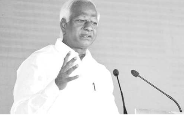
హైదరాబాద్: రాష్ట్రంలోని 81 జూనియర్ కాలేజీల్లో 1133 పోస్టుల భర్తీకి సీఎం చంద్రశేఖరరావు ఆమోదం తెలిపారు. పాఠశాల

విద్యాశాఖలోని సర్వశక్త అభియాన్ ఉద్యోగుల గౌరవ వేతనాలు, ఎస్ఎస్సి, కేజీబీటీఎస్ బోధన, బోధనేతర ఉద్యోగుల గౌరవ వేతనాల పెంపునకు కూడా సీఎం గ్రీన్ సిగ్నల్ ఇచ్చారు. ఈ మేరకు విద్యాశాఖ చేసిన పలు ప్రతిపాదనలకు సంబంధించిన ఫైలుమీద సంతకం చేశారు. వివరాలను డిప్యూటీ సీఎం కడియం శ్రీహరి మీడియాకు చెప్పారు. 2008లో అప్పటి ఉమ్మడిపాలకులు రాష్ట్రవ్యాప్తంగా 81 ప్రభుత్వ జూనియర్ కాలేజీలకు అనుమతించారు. అయితే పోస్టులు మాత్రం మంజూరు చేయలేదు. అప్పటినుంచి ఆ ఖాళీలు అలాగే ఉన్నాయి. కాలేజీల్లో నాణ్యమైన విద్యాప్రమాణాలు అందించే లక్ష్యంతో 1,133 కొత్త పోస్టులను మంజూరు చేస్తూ సీఎం కేసీఆర్ నిర్ణయం తీసుకున్నారని, ఈ పోస్టుల భర్తీ ప్రక్రియను త్వరలోనే ప్రారంభిస్తామని కడియం తెలిపారు.