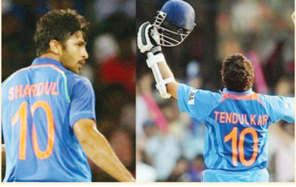
దిల్లీ: సచిన్ తెందుల్కర్ జెర్నీ నంబర్ 10ని ఎవ్వరికీ ఇవ్వొద్దని అభిమానులు బీసీసీఐని కోరుతున్నారు. అంతేకాదు అది తమకు ఎంతో ప్రత్యేకమైనదని, దాని విలువ వెలకట్టలేదని నెటిజన్లు సచిన్పై ఉన్న అభిమానాన్ని చాటుతున్నారు. ఆ నంబర్ని దయచేసి ఎవ్వరికీ కేటాయించవద్దని విజ్ఞప్తులు చేస్తున్నారు.

వన్డేలో అరంగేట్రం చేసిన సంగతి తెలిసిందే. మ్యాచ్ ప్రారంభానికి ముందు అతడు కోచ్ రవిశాస్త్రి చేతులమీదుగా వన్డే క్యాప్ని అందుకున్నాడు. తొలుత బ్యాటింగ్ చేపట్టిన భారత్ నిర్ణీత ఓవర్లలో 375 పరుగులు చేసింది. అనంతరం ఫీల్డింగ్ కోసం కోహ్లా సేవ మైదానంలో అడుగుపెట్టింది. అరంగేట్ర ఆటగాడు శార్దూల్ కూడా మైదానంలోకి వచ్చాడు. శార్దూల్ ధరించిన జెర్నీపై ఉన్న నంబర్ 10ని చూసి అభిమానులు ఆశ్చర్యం వ్యక్తం చేశారు. క్రెకట్ దేవుడు, మాస్టర్ బ్లాస్టర్ సచిన్ తెందుల్కర్ జెర్నీ నంబర్ 10 అని అందరికీ తెలిసిందే. దీంతో అభిమానులు 10వ నంబర్ని దయచేసి ఎవ్వరికీ కేటాయించవద్దు, అది ఎంతో ప్రత్యేకమైంది, క్రెకట్ దేవుడి నంబర్ని శార్దూల్కి ఎలా కేటాయిస్తారు, శార్దూల్.. దయచేసి సచిన్ జెర్నీ నంబర్ ధరించొద్దు, జెర్నీ నంబర్ 10 రిటైరయింది.. దయచేసి సచిన్ జెర్నీ నంబర్ మార్చుకో, ఈ నెంబరు ఎవ్వరికీ కేటాయించవద్దని బీసీసీఐకి అర్జమయ్యేలా చెప్పండి అంటూ ట్వీట్లలో అభిమానులు విజ్ఞప్తులు వెల్లువెత్తుతున్నారు. అరంగేట్ర వన్డేలో ఏడు ఓవర్లు వేసిన శార్దూల్ ఒక వెికెట్ తీసి 26 పరుగులు ఇచ్చాడు.