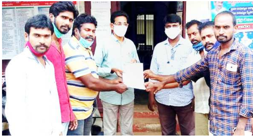
కాట్రేనికోనలో తాపీమేస్త్రైల సంఘం ధర్మా పరిష్కార కార్యక్రమంలో పాల్గొన్న వ్యక్తులు.