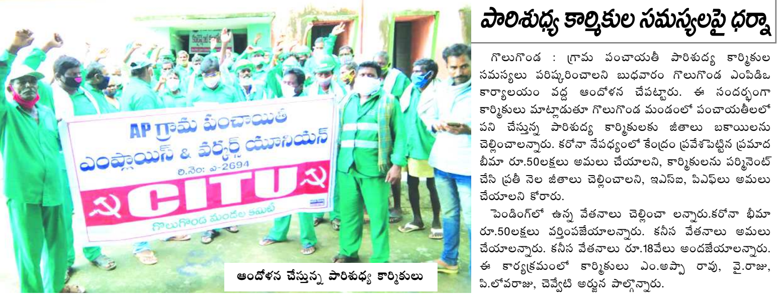
ఆందోళన చేస్తున్న పారిశుధ్య కార్మికులు

ఆరోగ్యంగా ఉండేందుకు గాను గణపతిపూజ కార్యక్రమము మరియు "చండీ హోమం" కార్యక్రమము గురువారం ఉదయం 8 గంటలు నుండి 12 గంటలు వరకు శ్రీశ్రీశ్రీ అయ్యప్పస్వామి సేవాపీఠం, లక్ష్మీపురం వద్ద జరుగునని, పూజాకార్యక్రమము జరుగునని చెప్పారు.కావున భీమిలి రూరల్ మండలంలో గల నాయకులు అందరు పాల్గొని జయప్రదము చేయవలసినిదిగా ఆయన కోరారు.