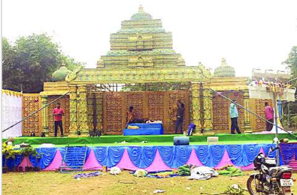
అప్పస్వ కల్యాణానికి ఏర్పాటు చేసిన కల్యాణ మండపం

ఈ రథంలో పాటుగా ఆర్థిక స్వాములు, ఇతర సిబ్బంది పాల్గొని కల్యాణ మహోత్సవం నిర్వహించనున్నట్లు తెలిపారు.