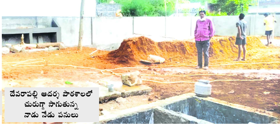
దేవరాపల్లి ఆడర్స్ పాఠశాలలో మరుగు సాగుతున్న నాడు నేడు పనులు