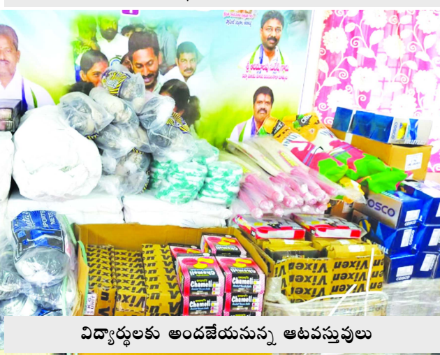
విద్యార్థులకు అందజేయనున్న ఆటవస్తువులు