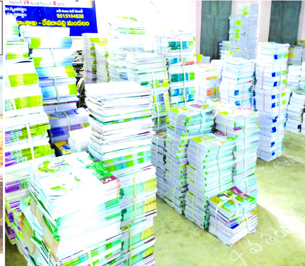
పంపిణీకి సిద్ధంగా ఉన్న పాఠ్యపుస్తకాలు

శాలలు, గురుకుల పాఠశాల, కస్తూరిబా గాంధీ విద్యాలయంలో పాటు మొత్తం 60 ప్రభుత్వ పాఠశాలలు ఉన్నాయి. వీటిలో నాడు-నేడు పడకం కింద తొలివిడతగా మండలంలో 21 పాఠశాలలకు రూ. 262. 65 కోట్ల రూపాయలు వెచ్చించి ఆయా పాఠశాలలకు అన్ని హంగులు సమకూర్చే విధంగా పనులను వేగవంతం చేస్తున్నారు. ఇదిలా ఉండగా మండలంలో అన్ని ప్రభుత్వ పాఠశాలలోని మొత్తం 6, 940 మంది విద్యార్థులు ఉన్నారు. అందులో 3, 640 మంది విద్యార్థులకు జగనన్న విద్యా కానుకలు రావాల్సి ఉంది. ఒకటో తరగతి నుంచి పదో తరగతి వరకు 19 వేల 774 నోట్ బుక్స్ రావాల్సి ఉండగా 6, 395 నోట్ బుక్స్ పంపిణీ చేయబడ్డాయి. ఇంకా 13 వేల 379 రావాల్సి ఉంది. ఇదిలా ఉండగా టెక్స్ బుక్స్ 8, 376 వర్క్ బుక్స్ 6, 136 అందు బాటులో ఉన్నాయి. అన్ని పాఠశాలలకు 19 రకాల స్నాచ్ మెటీరియల్ కూడా పంపిణీ చేయబడ్డాయి. త్వరలో సెంటింట్లలో ఉన్నవన్నీ తమ కార్యాలయానికి చేరు కుంటాయని మండల విద్యాశాఖాధికారి సిహెచ్. రవీంద్రబాబు తెలిపారు. ప్రస్తుతం తమ వద్ద ఉన్న పాఠ్య పుస్తకాలు, స్నాచ్ కిట్లు, ఇప్పటికే ఆయా పాఠశాలలకు పంపించామన్నారు. నాడు-