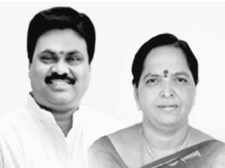
అవకాశం లేదన్నారు. విషయం త్వరలోనే విలేకర్ల సమావేశంలో తెలియ జేస్తున్నారు.

అదారంగా పరికరాన్ని పలుమార్లు పలు ప్రదేశాలలో వినియోగించినట్లు తెలిసింది. రాష్ట్ర మంత్రి ఇంటి వద్ద భారీ బందోబస్తు భద్రత, పోలీసుల హడావిడి అధికంగా వుంటాయి. సాధారణ మనిషిని లోపలకు వంపాలంటే ప్రాణ హింసకు గురిచేసే పోలీసులు ఏం సమాధానం చెబుతారో వేచిచూడాలి. ఇదే విషయమై సన్యాసిపాత్రుడి దంపతులను వివరణ కోరగా మాకు శత్రు తెవరా లెరవారు. మాకు చాలా దగ్గరగా వున్న వారవరా ఇటువంటి పని చేసే