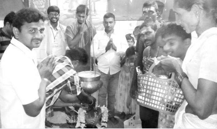
సరిపల్లిలో నేరుగా పరమేశ్వరుని ధర్మమందిరంపట్టు భక్తులు

పెండుర్తి : పూజారి గారు అనుగ్రహం ఉంటేనే తప్పా .... మనం దేవుని అనుగ్రహం పొందడం కష్టమనే విషయం మనకు ఏప్పుడో తెలుసు. కానీ 200 సంవత్సరాలు క్రితం ఆ గ్రామంలో పుట్టబడిన శివలయంలో భక్తులే నేరుగా అలయంలోకి వేళ్ళి ప్రత్యేక పూజలు, అభిషేకాలు నిర్వహించుకునేలా ఆ గ్రామా పెద్దలు భక్తులకు ఓ మందర్ల అవకాశం కల్పించారు. ఇంకేం మంది 365 రోజులు ఆ శివలయంలో భక్తులే వుండాలి. ఇక నిత్యం ఆ స్వామి వారికి భక్తులే కైంకర్యం, పూజలు చేయడం కనిపించే దృశ్యాల ఆ శివలయంలో కనిపిస్తాయి. దేశంలో ఏ దేవాలయంలోకి నేరుగా భక్తులను అనుమతించడం మనము చుడం... మరి విశాఖపట్నం జిల్లా, పెండుర్తి మండలం, సరిపల్లి గ్రామంలో ఉన్న శివలయం విశిష్టతను కార్యకర్తల సహకారం వల్ల ధర్మమందిరం అని ఆ అలయ విశిష్టతను గురించి తెలుసుకుందం రుంది. సరిపల్లి గ్రామం విశాఖపట్నం జిల్లాలో ఓకూడ మారుమూల గ్రామం. ఈ గ్రామం పెద్దలు చేప్పిన దాని ప్రకారం సూమారు 200 సంవత్సరాలు క్రితం ఈ గ్రామంలో చెరువుకు సమీపంలో ఉన్నా పంట పొలాల్లో రైతులు దుక్కు దుమ్ముతుండగా పరమేశ్వరుని విగ్రహం బయటపడింది. దీంతో అక్కడే పరమేశ్వరుని అలయం నిర్మాణం చేయించారు గ్రామా పెద్దలు. ఆ తరువాత ఆ అలయం లో నేరుగా భక్తులే స్వామిని ధర్మమందిరం, పూజలు, అభిషేకాలు నిర్వహించు కోవచ్చాని ఓ మంది అవకాశాన్ని భక్తులకు ఇచ్చారు ఈ గ్రామం పెద్దలు. అప్పటి నుంచి నేటి వరకు ఆ అలయానికి వచ్చే భక్తులే నేరుగా స్వామికి పూజలు చేసుకోని మహా ఆనందాన్ని పొందుతున్నారు. ఆ అలయం విశిష్టతను తెలుసుకోని జిల్లా నలుముల నుంచి భక్తులు ఈ అలయానికి కుటుంబ సమేతంగా చేరుకోని పరమేశ్వరునికి