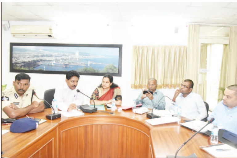
ఆంధ్రప్రదేశ్‌ను తీర్చిదిద్దాలనే లక్ష్యంతో రాష్ట్ర ముఖ్య కార్యదర్శి నేతృత్వంలో ఒక ఉన్నత స్థాయి కమిటీని ఏర్పాటు చేశారన్నారు. ఆ కమిటీ నిర్ణయం మేరకు రేపటి నుండి నెల రోజుల పాటు ప్రత్యేక డ్రైవ్ నిర్వహిస్తున్నట్లు ఆయన తెలిపారు. రాష్ట్రంలో తరువాయి 2లో

విశాఖపట్నం: గంజాయి సాగు రహిత రాష్ట్రంగా ఆంధ్రప్రదేశ్‌ను తీర్చిదిద్దాలని ప్రభుత్వం నిర్ణయించినది, అందుకు తగ్గట్టుగా నెల రోజుల కార్యచరణ ప్రణాళిక అమలుకు నేడే శ్రీకారం చుడుతున్నట్లు రాష్ట్ర ఎక్సైజ్ శాఖ కమిషనర్ పి. లక్ష్మీనరసింహం తెలిపారు. సోమవారం స్థానిక పోలీసు బ్యూరెక్స్‌లోని పోలీసు సమావేశ మందిరంలో ఎక్సైజ్, పోలీసు, రెవెన్యూ, ఐటీడిఏ, అటవీ శాఖల అధికారులతో ఆయన సమావేశమై కార్యాచరణ ప్రణాళిక అమలుపై సమగ్రంగా చర్చించారు. ఆయా శాఖల అధికారులు, సిబ్బందితో ఏర్పాటు చేసిన ప్రత్యేక టాస్క్‌ఫోర్స్ టీమ్లు తీసుకోవాల్సిన చర్యలను వివరించారు. అనంతరం ఆయన పాతికేయిలతో మాట్లాడుతూ గంజాయి సాగు, సాగుచేస్తున్న భూములపై పడిన అపకీర్తి విషయంలో రాష్ట్ర ముఖ్యమంత్రి నారా చంద్రబాబు నాయుడు తీవ్రంగా స్పందించారన్నారు. దేశంలోనే అత్యుత్తమ రాష్ట్రంగా ఆంధ్రప్రదేశ్‌ను తీర్చిదిద్దాలనే లక్ష్యానికి ఈ ఆపకీర్తి ఎంతో విహితం కల్పిస్తున్నట్లు ఆయన పరిగణించారన్నారు. గంజాయి సాగు రహిత రాష్ట్రంగా