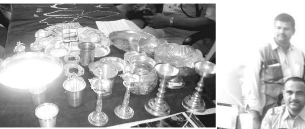
పెందుర్తిలో గ్రాం పోలీసులు పట్టుకున్న అయిదుగురు దొంగల నుంచి స్వాధీనం చేసుకున్న బంగారం, వెండి లక్ష రూపాయలు నగదు

-కేజి నుండి వెండి - 3తులాలు బంగారం -లక్ష రూపాయలు నగదు స్వాధీనం