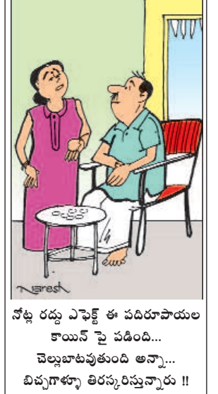
నేట్ల రద్దు ఎక్కణ్ణి ఈ పదిహారేమల కామన్ పై పెడింది... వెళ్లబట్టకుండా అన్నా... బిచ్చగాళ్ళు తరస్సరిస్తున్నారా !!