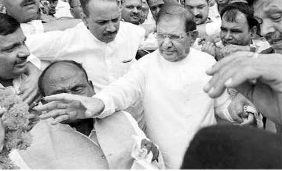
ప్రాతినిధ్యం వహిస్తున్నారు. తన మద్దతుదారులను సేకరించే పనిలో భాగంగా రాష్ట్రవ్యాప్త పర్యటనకు శరద్ సిద్ధమవుతున్న వేళ తాజా వేటుతో కొత్త పార్టీ ఏర్పాటు దాదాపు ఖాయంగానే కనిపిస్తోంది.