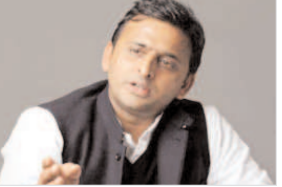
సంఖ్య 63కు పెరిగింది. ఆస్పత్రిలో ద్రవరూప ఆక్సిజన్ అందుబాటులో లేని కారణంగానే వీరంతా మృత్యువాత పడ్డారు. ఆగస్టు 9 నుంచి 11 వరకూ చోటుచేసుకున్న ఈ మరణాలు దేశవ్యాప్తంగా సంచలనం సృష్టించాయి. ఆక్సిజన్, వైద్యం అందక చిన్నారులు చనిపోవడంపై తీవ్ర విమర్శలు వెల్లువెత్తుతున్నాయి.

గోఖావార్: ఉత్తరప్రదేశ్ ముఖ్యమంత్రి యోగి ఆదిత్యనాథ్ ఇలాకాలోని బీఆర్డీ ప్రభుత్వ దవాఖానాలో పెద్దసభ్యుల్లో చిన్నారులు చనిపోయినపదకొండు మాజీ సీఎం, ప్రతిపక్ష నేత అఖిలేశ్ యాదవ్ అందోళన వ్యక్తం చేశారు. యోగి సర్కారు వైఫల్యానికి ఈ ఘటన నిదర్శనమని మండిపడ్డారు. 'బియార్డ్ మెడికల్ కాలేజీలో మరణాలపై యోగి సర్కారు నిజాలను వెల్లడించడం లేదు. సమాజ్ వాదీ పార్టీకి చెందిన ప్రతినిధుల బృందం ఆస్పత్రిని సందర్శించి క్షేత్రస్థాయిలోని వాస్తవ పరిస్థితిని వెలికితీసి.. ప్రభుత్వానికి తెలియజేయమని' అని చెప్పారు. 'రాష్ట్ర ప్రభుత్వం తన విధులను తాను నిర్వర్తించకుండా ఎన్నో కార్యక్రమాలను వెంటాడి పనిలో నిమగ్నమైంది. బరేలీ, బాలియాలలో జరిగిన ఘటనలే ఇందుకు నిదర్శనం' అని అఖిలేశ్ విమర్శించారు.