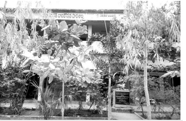
వేములపూడి బాలికల హైస్కూల్