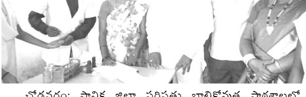
చోడవరం: స్థానిక జిల్లా పరిషత్తు బాలికొన్నత పాఠశాలలో