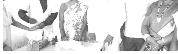
చోడవరం: స్థానిక జిల్లా పరిషత్తు బాలికాన్యత పాఠశాలలో