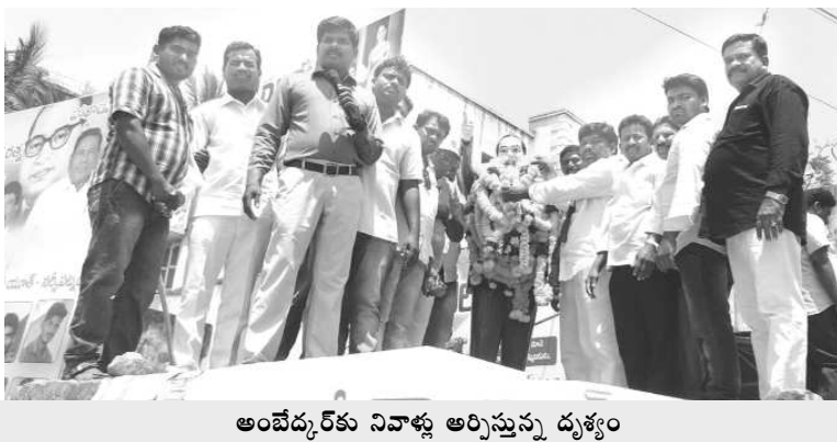
అంబేద్కర్ కు నివాళ్ళు అర్పిస్తున్న దృశ్యం