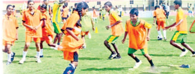
భువనేశ్వర్ : ఈ ఏడాది ఆక్టోబరులో అందరూ-17 ప్రపంచకప్ ఫుట్ బాల్ పోటీలు మనదేశంలో నిర్వహించనున్నారు. దీంతో దేశంలో వివిధ ప్రాంతాల్లో ఆల్ ఇండియా