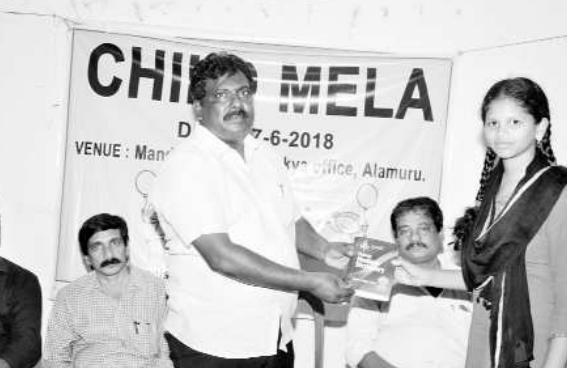
అలమూరు :- బాలబాలికలలో సృజనాత్మకమైన జ్ఞానాన్ని పెంపొందించాలనే ఉద్దేశ్యంతో అలమూరు శ్రమ వ్యయం చేసే సంస్థ ఆధ్వర్యంలో స్థానిక ప్రాథమిక కళాభవనంలో గురువారం "చైల్డ్ మేళ" నిర్వహించారు.