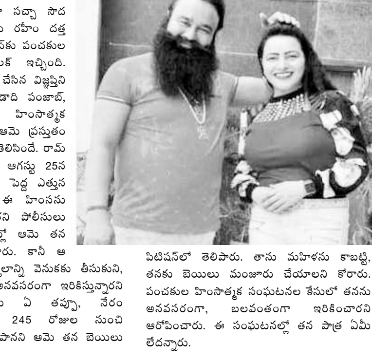
విడిపనలో తెలిసారు. తాను మహిళను కాబట్టి, తనకు బెయిలు మంజూరు చేయాలని కోరారు. పంచకుల హింసాత్మక సంఘటనల కేసులో తనను అరవసరంగా, బలవంతంగా ఇరికించారని ఆరోపించారు. ఈ సంఘటనల్లో తన పాత్ర ఏమి లేదన్నారు.