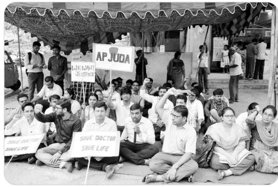
అన్ని రాష్ట్రాలలో అమలు చేస్తున్న విధంగా ఆంధ్రప్రదేశ్ లో కూడా తమకు స్టైఫెండెను ఇవ్వాలని కోరుతూ రెజిస్ట్రార్ ముందు సమ్మెకు దిగిన 20 మంది సూపర్ స్టెషిలిటీ విభాగానికి చెందిన జూనియర్ డాక్టర్లు.

అలమూరు :- అలమూరు మండలానికి కొత్తగా 720 ఫించన్లు మంజూరునట్లు ఎండీడి. నాటి బుజ్జి తెలిపారు. మరో 7గురికి సాంకేతిక కారణాలు వలన మంజూరు కాలేదని, వాటి వివరాలను తిరిగి ప్రభుత్వానికి సంపన్నులు త్వరలో అవకాశా మంజూరు కాబడతాయని ఆమె తెలిపారు. మంజూరు పత్రాలను శుక్రవారం చెబుడులంక గ్రామంలో జరిగే కార్యక్రమంలో శాసనమండలి డిప్యూటీ చైర్మన్ రెడ్డి సుబ్రహ్మణ్యం చేతులమీదుగా అందజేస్తారని ఆమె అన్నారు. లబ్ధిదారులకు ఫించన సొమ్ము రెండు మూడు రోజులలో ఆయా గ్రామపంచాయతీల వద్ద పంపిణీ చేయబడుతుందని ఎండీడి బుజ్జి తెలిపారు.