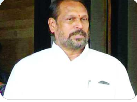
విద్యార్థి నాయకుల రాజకీయాల్లోకి..

'వచ్చే ఎన్నికల్లో ఖర్చు పెట్టడం కోసమే 2 వేల కోట్ల రూపాయలను ఇక్కడున్న రాజకీయ నాయకులు రహస్య స్థావరాలకు తరలించారని' ఒక కేంద్రమంత్రి స్వయంగా చెప్పారంటే రాజకీయ వ్యభిచారం ఏ స్థాయికి చేరిందో అర్థం చేసుకోవచ్చని పేర్కొన్నారు. డబ్బు సంపాదించడం కోసం అవినీతికి పాల్పడే రాజకీయ నాయకులు ఎంతటి డ్రోపాలి.. నోట్లు తీసుకుని ఓటు వేసే ప్రజలు సైతం అంతటి డ్రోహాలేనంటూ తీవ్ర స్థాయిలో మండిపడ్డారు.