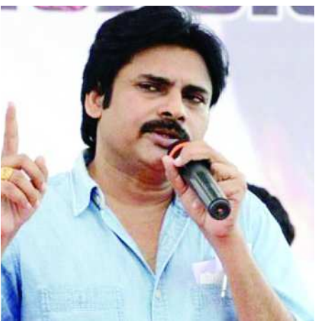
సోలీసులు చర్యలు చేపట్టారు. పవన్ కళ్యాణ్ కార్యక్రమానికి పెద్ద ఎత్తున జనసమీకరణకు వచ్చేందుకు తగిన ఏర్పాట్లు పూర్తి అయ్యాయి.

అనకాపల్లి : జనసేన అధినేత పవన్ కళ్యాణ్ శుక్రవారం అనకాపల్లికి విచ్చేస్తున్నారు. ఉత్తరాంధ్ర జిల్లాల పర్యాటక భాగంగా, ఆయన శుక్రవారం మాడుగుల నర్సపట్నం, పాపకాపూర్, ఎలమంచిలి మీదుగా అనకాపల్లి వెళుతుంటారు. నెహ్రూచోక్ జంక్షన్లో బహిరంగ సభ నిర్వహించారు. ఈ సందర్భంగా కార్యకర్తలు, ఇక్కడ ఏర్పాటు చేపట్టారు. స్టేజీలు ఏర్పాటు చేసారు. భారీగా స్వాగతం పలికేందుకు సన్నాహాలు చేస్తున్నారు. అనకాపల్లి నియోజకవర్గంలోని ప్రవేశించిన దగ్గర నుండి బైకే రా్యితో పట్టణంలోకి తీసుకువచ్చేందుకు పవన్ కళ్యాణ్ అభిమానులు తగిన చర్యలు తీసుకుంటున్నారు. నెహ్రూచోక్లో జనసేన జెండాలను, ఏర్పాటు చేసారు. ఎటువంటి అవాంఛనీయ సంఘటనలు జరగకుండా