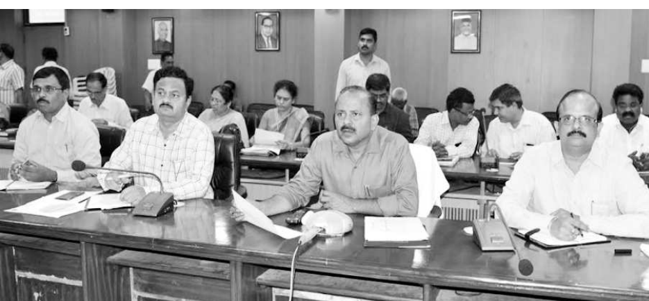
శాఖలకు డాక్ట్ మెంట్ల జారీ చేయాలని ఆదేశించారు. మీకోసం ద్వారా అందిన ఫిర్యాదులను త్వరితగతిన పరిష్కరించాలన్నారు.

వెనుకబడి ఉన్న శాఖలలో భూగర్భ గనుల శాఖ, ఈపీడీసీఎల్, రెవెన్యూ, మునిసిపల్, పోలీస్ శాఖలు ఉన్నాయి. మొక్కల పంపిణీలో 96% తో మొదటి స్థానం సాధించామని, అయితే వ్యవసాయ శాఖలో loan eligibility card హోల్డర్లకు కూడా రుణ సదుపాయం కల్పించే చర్యలు తీసుకోవాలని ఆదేశించారు. నూక్కు పోషకాలు, సాయిల్ డైస్టెంట్, ఎల్ఎస్ కార్బుల జారీ తదితర కార్యక్రమాలలో శతశాతం సాధించామన్నారు. పరిష్కార వేదిక ఫిర్యాదులలో నాలుగు జిల్లాలు శతశాతం సాధించాయని అందులో మన జిల్లా కూడా ఉండడం అభినందనీయమని కలెక్టర్ వివరించారు. పశుసంరక్షణ శాఖలో సైతం గడ్డి పంపిణీలో వెనుకబడి ఉన్నామని కలెక్టర్ తెలిపారు. అవసరమైన మరుగుదొడ్లు నిర్మించి బహిరంగ మల విసర్జన రహిత జిల్లాగా తీర్చిదిద్దినప్పటికీ ప్రజలలో మరింత అవగాహన కల్పించి వాటిని వినియోగించే విధంగా ఓ డి ఎఫ్ ప్లస్ లో అభివృద్ధి సాధించాలని కలెక్టర్ కోరారు.