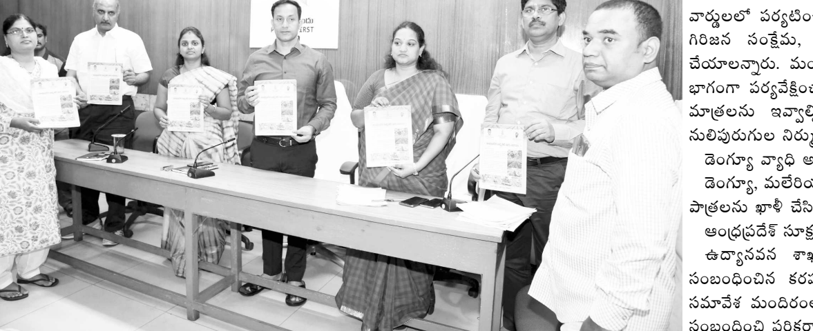
విశాఖపట్నం : ఈ నెల 10వ తేదీన జాతీయ సులిపురుగుల నిర్మూలన దినం రాష్ట్రీయ బాల స్వాస్థ్య కార్యక్రమం (ఆర్.బి.ఎన్.కె) పథకంలో భాగంగా జిల్లా వ్యాప్తంగా 1 నుండి 18 సంవత్సరాల వయస్సు గ