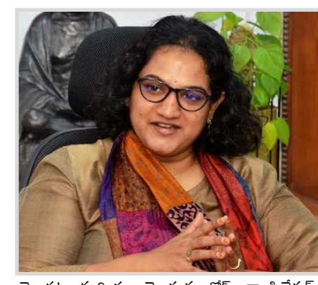
మొదట మరియు రెండవ డోస్ వ్యాక్సినేషన్ వేయించుకోవాలని ప్రజలకి విజ్ఞప్తి చేశారు. కోవిడ్ నిబంధనలు పాటించి అందరూ వ్యాక్సినేషన్ వేయించుకోవాలని కమిషనర్ తెలిపారు.

- జివిఎంసీ కమిషనర్ డా. జి.స్రజాను విశాఖపట్నం :- మహా విశాఖపట్నం నగరపాలక సంస్థ పరిధిలోని 72 పట్టణ ప్రాథమిక ఆరోగ్య కేంద్రాలలో మరియు 400 సచివాలయాలలో నేడు అనగా తేది.17-09-2021న(శుక్రవారం) కోవాక్సిన్ మరియు కోవిషిల్డ్ వ్యాక్సినేషన్లు వేయబడుతున్న జివిఎంసీ కమిషనర్ డాక్టర్ జి. స్రజాను ఒక ప్రకటనలో తెలిపారు. కావున అందరు జోనల్ కమిషనర్లు, వార్డు ప్రత్యేక అధికారులు ఎఎంఐహెచ్ఎల్ లు, శానిటరీ సూపర్వైజర్ లు, శానిటరీ ఇన్స్పెక్టర్లు వ్యాక్సినేషన్ కార్యక్రమంలో పాల్గొని, వ్యాక్సినేషన్ కార్యక్రమాన్ని జయప్రదం చేయండి. ముఖ్యంగా 18 సం.ల యువ పిల్లల వారు, గర్భిణీ స్త్రీలు, బడు సంవత్సరాల లోపు పిల్లలు ఉన్న తల్లిదండ్రులు, టీచర్స్ కు వ్యాక్సినేషన్ వేయించాలని, అర్హత కలిగిన వారందరూ