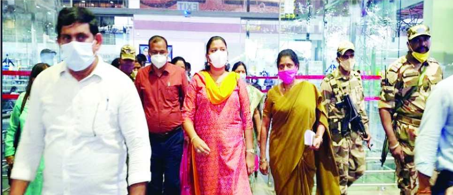
విశాఖపట్నం : విశాఖ, పార్లమెంట్ మహిళా సాధికారత కమిటీ మూడు రోజుల పర్యటన నిమిత్తం హైదరాబాద్ నుంచి గురువారం విశాఖ విమానాశ్రయానికి చేరుకున్నారు. ఈ కమిటీలో లోక్ సభ సభ్యులు 20వంది, రాజ్యసభ సభ్యులు పదిమంది వచ్చారు. విమానాశ్రయం నుంచి నేరుగా నోవాటెల్ కు చేరుకున్నారు. 17 వ తేదీన నేవల్ డాక్ యార్డ్ , విశాఖ పోర్టును సందర్శించనున్నారు. రాత్రి 7 గంటలకు ది పార్టీ హెటల్ లో బ్యాంక్ ఆఫ్ ఆండియా ఏర్పాటు చేసిన విందులో పాల్గొని, 18 న ఎండా డలోని దిశ పోలీసు స్టేషన్ను సందర్శించి . అక్కడ మహిళా పోలీసులతో సమావేశం చేయవలసి తెలిపారు.