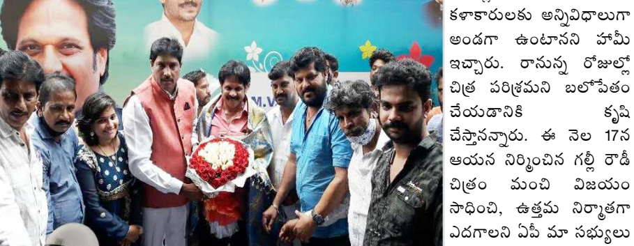
విశాఖపట్నం : ఎంపీ గా, నిర్మాతగా ఎంపీవీ సత్యనారాయణ కళారంగాని ప్రోత్సహిస్తూ, కళాకారులకు అండగా ఉంటున్నారని ఆంధ్రప్రదేశ్ మూవీ అకాడమీ అసోసియేషన్ (ఏఏఎమ్) సభ్యులు పేర్కొన్నారు. గురువారం ఎంపీ, నిర్మాత ఎంపీవీ సత్యనారాయణ పుట్టినరోజు సందర్భంగా లాస్ట్ చే కాన్ఫరెన్స్ లో ఏఏఎమ్ సభ్యులు ఆయన్ను కలిసి దుశ్శాలువ తో సత్కరించి, పుష్పగుచ్ఛాలు అందజేసి శుభాకాంక్షలు తెలియజేశారు. అనంతరం ఎంపీ