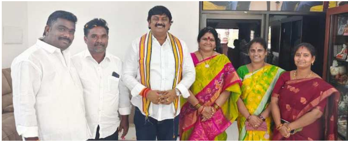
శుభాకాంక్షలు తెలియజేస్తున్న గొలుగొండ వైస్ ఎంపీ దంపతులు