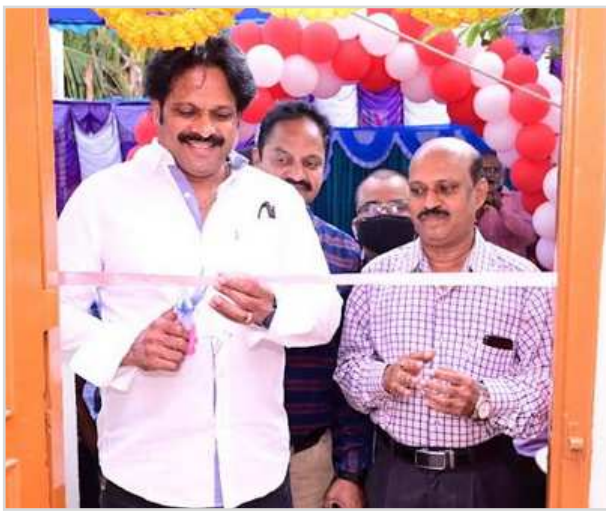
ఆరోవ లో సూతన సబ్ పోస్ట్ ఆఫీస్ ను విశాఖ పోర్లమెంట్ సభ్యులు ఎంపీవీ సత్యనారాయణ ప్రారంభించారు

విశాఖపట్నం : (విజయభాను న్యూస్ ): పండగల వేల నిబంధనలకు విరుద్ధంగా తిరుగుతున్న ప్రయివేట్ ట్రావెల్స్ బస్సులపై రవాణాశాఖ అధికారులు కొరడా జాలిస్తున్నారు. ఈమేరకు హైదరాబాద్ నుండి ఇటువంటి పర్యటి లేకుండా భువనేశ్వర్ వెళ్తున్న ప్రయివేట్ ట్రావెల్స్ బస్సు ను ఆగనంపూడి టోల్ ప్లాజా వద్ద రవాణాశాఖ అధికారులు గుర్తించారు. బస్సు కి అనుమతులు లేకపోవడంతో బస్సు ను సీట్ చేసి ఆర్ .ఆండ్ .బి కూడలి వద్ద నున్న డ్రైవింగ్ ట్రాక్ వద్దకి తరలించారు. దింతో ప్రయాణికులు తీవ్ర ఇబ్బందులను ఎదుర్కొన్నారు. అయితే ట్రావెల్స్ నిర్వహకులు మరో బస్సు ను ఏర్పాటు చేసి ప్రయాణికులను తరిలించారు.