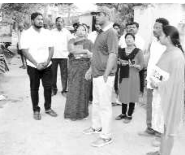
రోడ్ డెవలప్ మెంట్ ప్లాన్ ప్రకారం నిర్మిస్తుంది, ఏ ఒక్కరికి ఇబ్బంది తెకుండా చూస్తుంది పేర్కొన్నారు.

తదుపరి ఎన్.యస్.టి.ఎల్ రోడ్ నుండి సింహపాలానికి వెళ్ళే రోడ్ వరకు అభివృద్ధిచేయాలని కోరారు. స్థానికుల ఆపోహలను తొలగిస్తూ 60 అడుగుల రహదారిని ఏర్పాటు చేయాలని కోరారు. జోన్ లోని అన్ని చెరువులను వాటి చుట్టూ కరకట్టలను ఏర్పాటు చేయాలని ఆదేశించారు. చెరువులను రక్షించుకోవడంలో బాటు భూగర్భ జలాలు స్థిరీకరణకు దోహదపడుతుందని అభిప్రాయపడ్డారు.