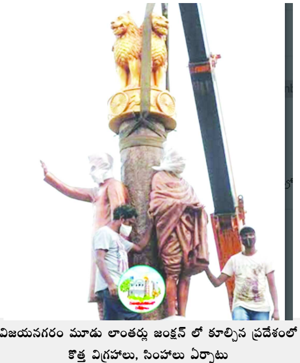
విజయనగరం మూడు లాంతర్లు జంక్షన్ లో కూల్చిన ప్రదేశంలో కొత్త విగ్రహాలు, సింహాలు ఏర్పాటు

మిడతల ఉనికిని గుర్తించడానికి ఉపగ్రహ సాంకేతిక పరిజ్ఞానం ఉపయోగపడదు. కానీ ఉమ్మడి ప్రయోజనాలపై ప్రభుత్వాలకు చిత్తశుద్ధి లేనప్పుడు ఎంత సాంకేతిక అభివృద్ధి జరిగితే మాత్రం ఏమీ లాభం! కరోనా వైరస్, మిడతల దాడుల వంటివి విరుచుకుపడినప్పుడైనా మనం ఆత్మపరిశీలన చేసుకుంటే మంచిది.