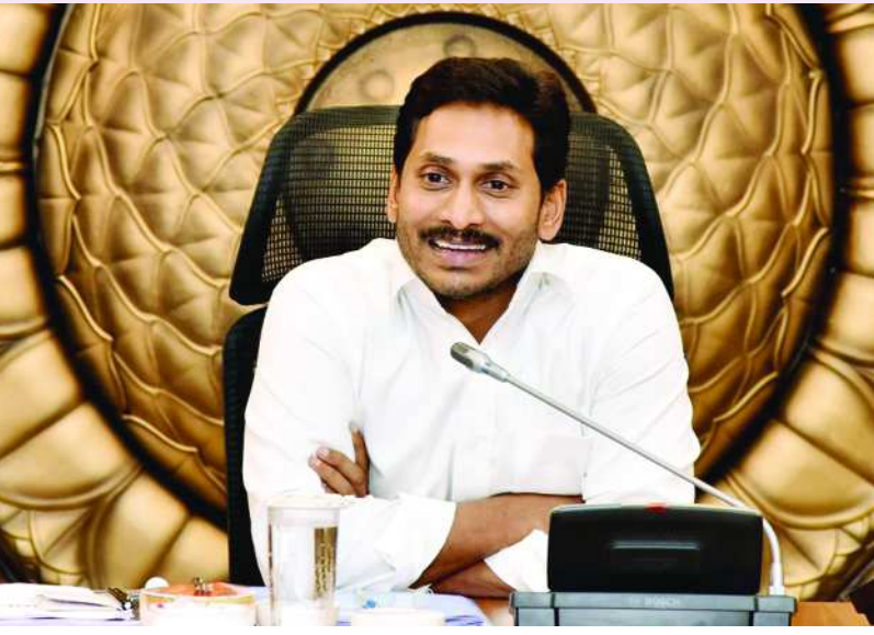
ఉగాది నాటికి 26.6 లక్షల ఇళ్లపట్టాలు ఇవ్వనున్నామని, వచ్చే నాలుగేళ్లలో 30 లక్షలకు పైగా ఇళ్లను నిర్మించబోతున్నామని సీఎం వైఎస్ జగన్ తెలిపారు. సమావేశంలో గృహ నిర్మాణ శాఖ మంత్రి చెరుకువాడ రంగనాథరాజు, ఇతర అధికారులు తరువాయి 2లో..

అమరావతి: ముఖ్యమంత్రి వైఎస్ జగన్మోహన్ రెడ్డి శుక్రవారం గృహ నిర్మాణ శాఖ అధికారులతో క్యాంపు కార్యాలయంలో సమావేశమయ్యారు. పేదల ఇళ్ల నిర్మాణానికి సంబంధించిన కార్యాచరణపై సుదీర్ఘంగా చర్చించారు. ఇప్పటినున్న ఇళ్లపట్టాలు, నిర్మించాల్సిన ఇళ్లపై పూర్తిస్థాయిలో సమీక్షించారు. ఇళ్ల నిర్మాణం విషయంలో ప్రతిఏటా నిర్మించాల్సిన లక్ష్యాలపైనా చర్చించారు. పట్టణ, నగరాభివృద్ధి సంస్థలు, గ్రామీణ ప్రాంతాల్లో పేదలకు ఇళ్ల నిర్మాణంపై కేంద్ర ప్రభుత్వ ప్రయోజిత పథకాలు, వాటినుంచి ఇప్పటివరకూ మంజూరైన ఇళ్ల వివరాలను సీఎం వైఎస్ జగన్ ఆడిగి తెలుసుకున్నారు. కేంద్ర ప్రభుత్వ పథకాల అమల్లో భాగంగా ఇంకా ఎన్ని ఇళ్ల రాష్ట్రానికి మంజూరు అవడానికి ఆస్కారం ఉందన్న అంశాలపై అధికారుల నుంచి వివరాలు తీసుకున్నారు. ఈమేరకు కేంద్ర ప్రభుత్వం నుంచి వచ్చేందుకు ఆస్కారం ఉన్న నిధులు, అదిపోనూ రాష్ట్ర ప్రభుత్వం నుంచి ఏ మేరకు నిధులు అవసరమన్న దానిపై చర్చించారు. మొత్తం మీద ఈ