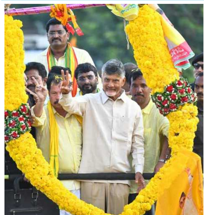
చంద్రబాబు తేల్చి చెప్పారు. విజయనగరం జిల్లాకు చెందిన తెదేపా నేతలతో పెద్ద సంఖ్యలో ప్రజలు రోడ్ షోకు హాజరయ్యారు.

నెల్లిమర్ల: 'క్యూట్ జగన్.. సేవ ఆంధ్రా'.. నినాదంతోనే ఆంధ్రప్రదేశ్ లో ఉద్యోగాలు వస్తాయని తెదేపా అధినేత చంద్రబాబు అన్నారు. ఉత్తరాంధ్రపై విజయసాయిరెడ్డి, వైపి సుబ్బారెడ్డి పెత్తనం ఏంటి? అని ప్రశ్నించారు. విజయనగరం జిల్లా నెల్లిమర్లలో నిర్వహించిన రోడ్ షోలో చంద్రబాబు మాట్లాడారు. నిత్యావసరాల ధరలు పెంచి పేదలను ఇబ్బంది పెడుతున్నారని మండిపడ్డారు. మంత్రి బొత్తు సత్యనారాయణకు సారా వ్యాపారం మాత్రమే తెలుసునని.. అలాంటి వ్యక్తి రాష్ట్రానికి విద్యాశాఖ మంత్రిగా ఉన్నారని ఎద్దేవా చేశారు. తనకు ఎలాంటి పదవులు అక్కర్లేదని.. రాష్ట్రం కోసమే తన బాధాంతా అని ఆవేదన వ్యక్తం చేశారు. నిజాయతీపరుడైన అశోక్ గజపతిరాజును ఈ ప్రభుత్వం వేధిస్తోందని.. ఎన్నికలకాగా ఇబ్బంది పెట్టిన అశోక్ ధైర్యంగా నిలబడారని చెప్పారు. మేం టిట్లో ఇళ్లు కట్టాం.. వాటిని లబ్ధిదారులకు సీఎం జగన్ ఇచ్చారా? అని ప్రశ్నించారు. తెదేపా కార్యకర్తలకు ఫ్లూలు, ఇళ్లు ఇవ్వడం లేదని, ఇళ్లు కట్టుకున్న వారికి బిల్లులు ఇవ్వడం లేదని ఆక్షేపించారు. ఈ రాష్ట్రాన్ని బాగు చేసే శక్తి దేవుడు తనకిచ్చాడని.. తాటాకు చప్పుళ్లు భయపడేది లేదని చంద్రబాబు తేల్చి చెప్పారు. విజయనగరం జిల్లాకు చెందిన తెదేపా నేతలతో పెద్ద సంఖ్యలో ప్రజలు రోడ్ షోకు హాజరయ్యారు.