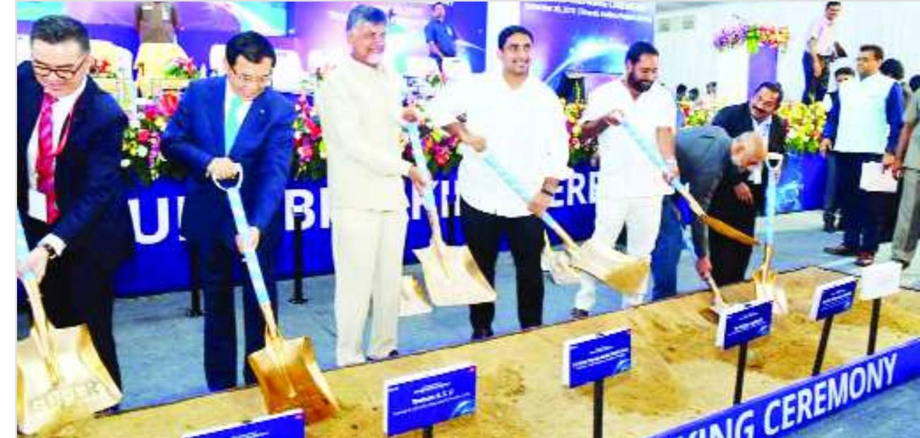
తిరుపతి: తిరుపతిలో టీసీఎల్ ఎలక్ట్రానిక్స్ మాన్యుఫ్యాక్చరీంగ్ యూనిట్ కు ఏపీ సీఎం చంద్రబాబు నాయుడు గురువారం శంకుస్థాపన చేశారు. టీసీఎల్ చైర్మన్ లీ డాంగ్ పెంగ్ తో కలిసి చంద్రబాబు భూమిపూజ నిర్వహించారు. ప్రపంచంలోనే అతిపెద్ద టీసీ ప్యాపర్స్ ఉత్పత్తి సంస్థలో చైనాకు చెందిన టీసీఎల్ ఒకటి. తిరుపతిలోని ఎలక్ట్రానిక్స్ క్లస్టర్ లో 158 ఎకరాల్లో ఈ యూనిట్ ను ఏర్పాటు చేస్తున్నారు. చైనా తరువాయి 2లో..