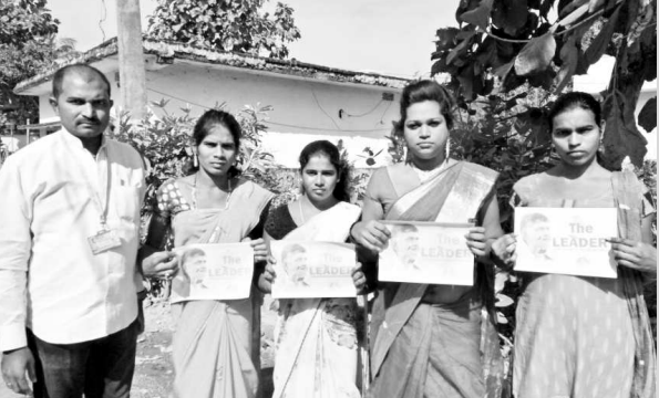
తెలుగుదేశం పార్టీకి సర్వపట్నం నియోజకవర్గ హిజ్రాలకు మద్దతు