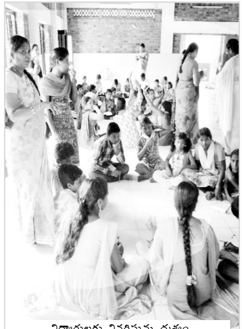
విద్యార్థులకు వివరాలు ద్వారా

నిర్వహించారు. ఈ సందర్భంగా క్రాఫ్ సర్వపట్నం డివిజన్ ప్రతినిధి బికె.ఎం.పాల్వే మాట్లాడుతూ ఇటీవల కాలంలో బాలలపై లైంగిక వేధింపులు, లైంగిక దోపిడి, లైంగిక దాడుల సంఖ్య పెరిగిపోయాయి. దేశంలో బాలలపై హద్దులుమీరి జరుగుతున్న లైంగిక వేధింపుల్లో కొద్ది శాతం మాత్రమే ఫిర్యాదుల వరకు వస్తున్నాయిన్నారు. చాలా సందర్భాల్లో లైంగికంగా వేధించిన వారు కుటుంబ సభ్యులతో లేక దగ్గర బంధువులేదా పరిచయం ఉన్న వ్యక్తి కావడంతో ఎక్కువ ఫిర్యాదు చేయడం లేదన్నారు. ఒక సర్వే ద్వారా గమనించిన ప్రకారం 53శాతం బాలలు ఒకటి లేదా అంతకంటే ఎక్కువశాతం వారి జీవిత కాలంలో వేధింపులకు గురవుతున్నప్పటికీ ఫిర్యాదుల విషయంలో బాధితులు గానీ, వారి తల్లిదండ్రులుగానీ ముందుకు రాకుండా ఉండిపోతున్నట్లు సర్వేలు స్పష్టం చేస్తున్నాయిన్నారు. బాలలపై లైంగిక దాడులు జరిగిన తర్వాత మనం వారికి న్యాయసహాయం చేసే కంటే లైంగికంగా హక్కుల ఉల్లంఘనలు జరగక ముందే మనం బాలలను కాపాడుకోవాల్సిన అవసరం ఉందన్నారు. సమీక అసంతరం బాలల హక్కులపైనే, లైంగిక వేధింపులపై నివారణ చర్యలు గురించి కొన్ని ప్రశ్నలతో కూడిన నివేదికను తయారు చేశారు. ఈ నివేదికను రాష్ట్ర జాతీయ బాలల హక్కుల కమిషన్లకు పంపించడం జరుగుతుందన్నారు. ఈ కార్యక్రమంలో గ్రామస్థులు, మహిళలు, విద్యార్థులు పాల్గొన్నారు.