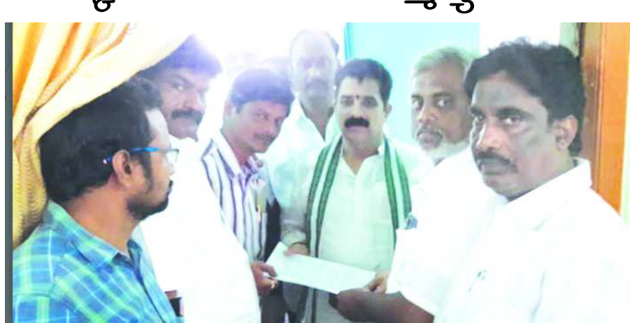
ఎమ్మెల్యే ధర్మశ్రీకి వినతిపత్రం అందిస్తున్న మీ సేవ నిర్వాహకులు

చోడవరం : పట్టణంలోని మీ సేవా కేంద్రాల నిర్వాహకుల సమస్యలు పరిష్కరించాలంటూ చోడవరం నియోజకవర్గంలోని మీ సేవా కేంద్రం ఆపరేటర్లు స్థానిక ఎమ్మెల్యే కరణం ధర్మశ్రీకి గురువారం వినతి పత్రం అందజేశారు. ప్రభుత్వ సేవలు, ప్రజలకు సేవలు అందించే ముఖ్య ఉద్దేశ్యంతో అప్పటి దివంగత ముఖ్యమంత్రి వై.యస్.రాజేశ్వర్ రెడ్డి మీ సేవలు ఏర్పాటు చేయడం జరిగిందని, వీటిని ఆధారంగా లక్షలాది కుటుంబాలు ఉపాధి పొందుతూ ప్రజలకు సేవలు అందిస్తున్నాయని, అయితే ప్రస్తుత ప్రభుత్వం గ్రామ సచివాలయాలు ఏర్పాటు చేయడం ద్వారా మీ సేవ కేంద్రాల నిర్వాహకుల కమిషన్ ఆదాయంపై ప్రభావం పడే అవకాశమందనని, ముఖ్యమంత్రి జగన్మోహన్ రెడ్డి డీనిని పరిశీలించి గ్రామ సచివాలయాల నియామకాలలో ఉద్యోగం కల్పించాలని ఎమ్మెల్యేను కోరారు. ఈ కార్యక్రమంలో ఉపాధ్యక్షులు శ్రీనివాస్ తదితరులు పాల్గొన్నారు.