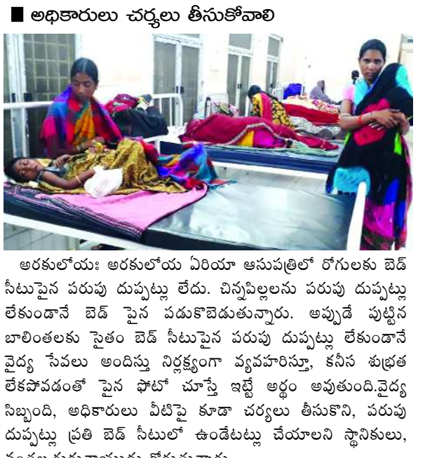
అరకులోయ: అరకులోయ ఏరియా ఆసుపత్రిలో రోగులకు బెడ్ సీటుపైనే పరుపు దుప్పట్లు లేదు. చిన్నపిల్లలను పరుపు దుప్పట్లు లేకుండానే బెడ్ పైనే పడుకొబెడుతున్నారు. అప్పుడే పుట్టిన బాలింతలకు పైతే బెడ్ సీటుపైనే పరుపు దుప్పట్లు లేకుండానే వైద్య సేవలు అందిస్తు నిర్లక్ష్యంగా వ్యవహరిస్తూ, కనీస శుభ్రత లేకపోవడంతో పైనే పోట్ల చూస్తే ఇళ్ల అర్థం అవుతుంది. వైద్య సిబ్బంది, అధికారులు వీటిపై కూడా చర్యలు తీసుకొని, పరుపు దుప్పట్లు ప్రతి బెడ్ సీటులో ఉండేట్లు చేయాలని స్థానికులు, వంతల.గురునాయుడు కోరుతున్నారు.