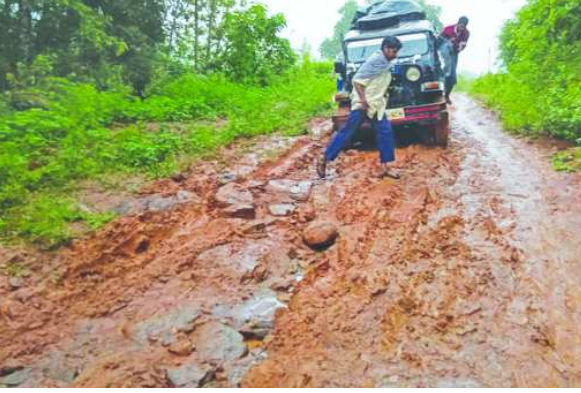
రైవా రోడ్డు మంజూరు చేయించి ప్రజలకు రోడ్డు కష్టాలనుంచి మోక్షం కలిగించాలని ప్రజలు కోరుతున్నారు.

అనంతగిరి : హుకుంపేట నుంచి పాటిపల్లి గ్రామంనకు రోడ్డుకు అనుకొని సుమారు 100 గ్రామాలు ఉంటాయి. 5000 జనాభా ఉంటారు. ఈ రహదారి నుండి రెండు మండలాలకు చెందిన ప్రజలు రోజూ రాకపోకలు జరుపుతుంటారు. ఇటు హుకుంపేట, అటు అనంతగిరి మండలాల ప్రజలు మండల కేంద్రాలకు వెళ్లాలంటే ఈ దారి గతి. ఇటు హుకుంపేట మండల లానికి సంబంధించి గనికే, దిరపిల్లి గ్రామాలు మొదలు కొని, అటు అనంతగిరి మండలానికి చెందిన చివరి ప్రాంతాలైన తునిసిబు, ముద్దిభ, పాటిపల్లి గ్రామ ప్రజలు ఈ రోడ్డు నుండి రావాలి. మేము ఎన్నో పర్యాయాలు రాజకీయ నాయకులకు, ప్రభుత్వ అధికారులకు రోడ్డు గురించి వివరాలు చెప్పాము. కానీ ఎవరూ మా గొడు పట్టించుకోలేదు. ఎంతో మంది మోటార్ సైకిల్ ల నుండి జారిపడి హాస్పిటల్ పాలు అవుతున్నారు. ఈ రోడ్డు లో ఎన్నో ప్రమాదాలు కూడా జరిగాయి. జరుగు తూనే ఉంటున్నాయి అధికారులు ఇప్పటి