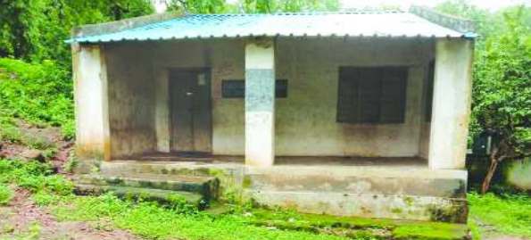
ఉపాధ్యాయుడు లేక మాతవడిన సంఖ్యపల్లె పాఠశాల

సంఖ్యపల్లె గ్రామములో పాఠశాలకు ఉపాధ్యాయుడుని పంపించాలని అధికారులకు గ్రామస్థులు వినతి