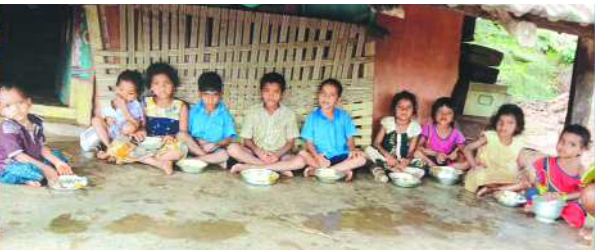
ఇంటిపద్ద భోజనం చేస్తున్న విద్యార్థులు

అనంతగిరి : అనంతగిరి మండలంలోని గుమ్మకోట పంచాయతీలో గల సంఖ్య పల్లె గ్రామములో, పాఠశాల కలదు. పాఠశాలలో 24 మంది పిల్లలు ఉన్నారు ఆ పాఠశాలకు ఉపాధ్యాయుడు వెళ్ళే దాకాలూ లేవు పిల్లలు మధ్యాహ్నం వరకు ఉండి మధ్యాహ్నం భోజనం చేసి ఇంటికి వెళ్లి పోవడం జరుగుతుందని పిల్లల తల్లిదండ్రులు తెలుపుతున్నారు ఈ కారణంగా మా పిల్లలను మేము పనులు లోనికి తీసుకెళ్లి పోతున్నామని ఉపాధ్యాయుడు మాకు కనిపించని దాఖలాలూ లేవని పిల్లల తల్లిదండ్రులు వాపోతున్నారు. ఇప్పటికైనా మండల అధికారులు స్పందించి పాఠశాలకు ఉపాధ్యాయుడు వచ్చే విధంగా చర్యలు తీసుకోవాలని సంఖ్య పల్లె గ్రామ ప్రజలు పిల్లల తల్లి తల్లిదండ్రులు కోరుచున్నారు.