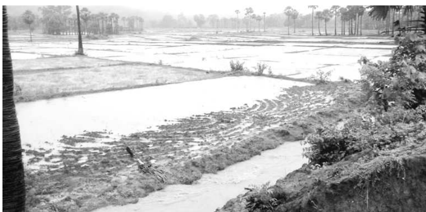
వర్షాలెరుపుకు మడుం నిర్మాణం వీలుగా గట్టు తవ్విన ప్రదేశం ద్వారా వరద నీరు వెళుతున్న దృశ్యం

కొయ్యూరు : యు.పీడిపాలెం పరిధిలో నీరు చెట్టు పథకంలో మరమ్మత్తులు చేపట్టిన రెండు చెరువులు ఇటీవల కురిసిన వర్షాలకు చేరిన వరదనీటికి గండి పడి సుమారు 200 ఎకరాల పైబడి వరినాట్లకు సిద్దమైన నారుమడులు నీట మునిగాయి. వివరాల్లోకి వెళ్తే యు.పీడిపాలెం గ్రామానికి ఆనుకొని పంచాయతీ కార్యాలయం పక్కనే ఉన్న పల్లాల చెర్లు, పల్లాలవీధికి ఆనుకొని ఉన్న ఎర్రచెరువు గత మూడు రోజులుగా కురుస్తున్న భారీ వర్షాలకు ఎర్రగొండ, ఉల్లిగుంట, కంపుమానుపాకల మీదుగా వచ్చే కొండవారు ప్రవాహాల ద్వారా చేరిన వరదనీటికి నీట