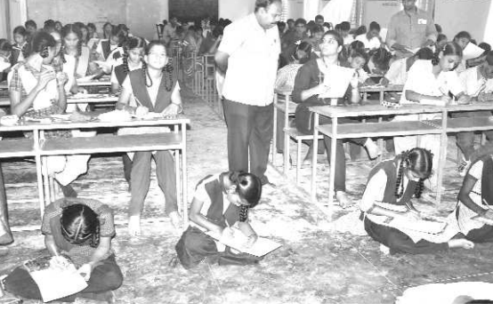
విజయనగరం: జూలై 24న గ్రంథాలయ ఉద్యమ