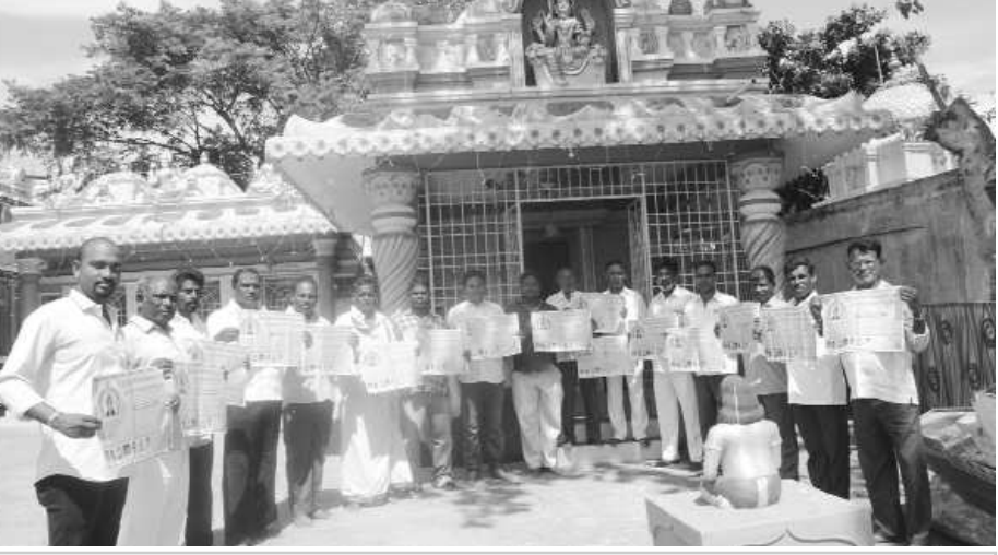
గోడవతిక విడుదలచేస్తున్న పెదజాలరిపేట కాలనీ పెద్దలు

విశాఖపట్నం : స్థానిక పెదజాలరిపేటలో గల రమణముత్యాలమ్మవారి ఉత్సవాలు మంగళ వారం ఘనంగా ప్రారంభమయ్యాయి. ఈ మేరకు ఇక్కడి సదసుపుట్ట వద్ద అమ్మవారి ఉత్సవాల గోడవతికను మంగళవారం కాలనీ పెద్దలు విడుదలచేశారు. ఈ సందర్భంగా వారు మాట్లాడుతూ అమ్మవారి తొలెళ్ళు ఈ నెల 24వ తేదీన, అనువు ఉత్సవం 25 వ తేదీన జరుగుతాయిన్నాయి. అనువురోజు సాయంత్రం 6 గంటలకు సదసుపుట్ట నుంచి ప్రారంభమై ఊరేగింపు ఊడా పార్కు, మానసిక ఆసుపత్రి, పెదవాలేరు ప్రాంతాలమీదుగా సాగుతుందన్నారు. ఈ సందర్భంగా 41 అడుగుల అమ్మవారి బొమ్మ ఊరేగింపు జరుగుతుందని తెలిపారు. 25