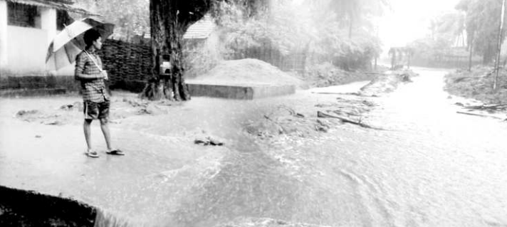
మురుగునీటి వీధి కాలువల నిర్మాణాలకు తప్పిన కాలువల నుండి పొంగి ప్రవహిస్తున్న వరదనీరు

కొయ్యూరు : యు.పీ.డి.పాలెం గ్రామంలో వీధి కాలువల ఏర్పాటు గత కొన్ని మాసాలుగా అసంపూర్ణంగా నిలిపి వేయడంతో ఇటీవల కురుస్తున్న వర్షాలకు కొండవాలు నుంచి వచ్చే వరదనీరు కాలువలోకి చేరి పొంగి ప్రవహిస్తుండటంతో గ్రామం జలదిగ్భం ధమైంది. యు.పీ.డి.పాలెం గ్రామంలో వీధి కాలువల నిర్మాణాలకు తీసిన కాలువల గ్రామస్థుల పాలిటా శాపంగా మారింది. గ్రామంలో వాడుక నీరు ఊరి బయటకు తరలిం చేయడం వీలుగా మురుగునీటి కాలువలు నిర్మాణాలు పంచాయతీ