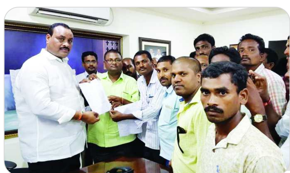
నిమ్మాడ క్యాంపు కార్యాలయంలో సాక్షర భారత్ సిబ్బందిని ఆడుకోవాలని మంత్రి కింజరాపు అచ్చెన్నాయుడుకు వినతిపత్రం అందజేశారు.