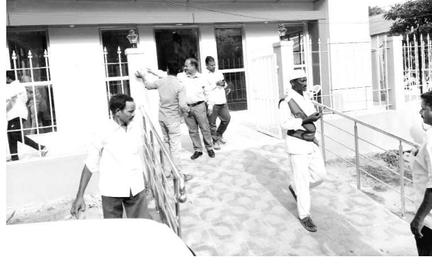
కంచరపాలెం : పేద ప్రజలకు తక్కువ ఖర్చుతో కడుపు నిండ భోజనం అందించే లక్ష్యంతో రాష్ట్ర ప్రభుత్వం ఆధ్వర్యంలో ఏర్పాటు కానున్న అన్న క్యాంటీన్ లు ప్రారంభానికి సిద్ధమయ్యాయి. ఈ

పనులు పరిశీలించిన జీవీఎస్ జోన్ -4 కమిషనర్ ఎస్.రమణమూర్తి