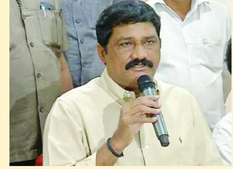
విశాఖపట్నం: జనసేన అధినేత పవన్ కళ్యాణ్ అవాస్తవాల ప్రచారం చేస్తున్నారని మంత్రి గంటా శ్రీనివాసరావు మండిపడ్డారు. విశాఖపట్నంలో ఆయన మీడియాతో మాట్లాడుతూ.. పవన్

కళ్యాణ్ కు 25 ప్రశ్నలను సంధించారు. పాలవరం సహా ఇతర సాగునీటి ప్రాజెక్టుల్ని పవన్ కళ్యాణ్ కళ్లతో చూడలేని స్థితిలో ఉన్నారని ఎద్దేవా చేశారు. తెలుగుదేశం పార్టీని గెలిపించింది తానే అనే భ్రమలో ఆయననున్నారని ఆక్షేపించారు. ఫ్యాక్ట్ ఫైండింగ్ కమిటీ తేల్చిన నిధుల లెక్కపై పవన్ కేంద్రాన్ని ఎందుకు ప్రశ్నించడం లేదని గంటా నిలదీశారు. రైల్వేజోన్, ఉత్తరాంధ్ర ప్రత్యేక ప్యాకేజీ ఇలా ప్రతి అంశంలోనూ తెలుగు దేశాన్ని మాత్రమే లక్ష్యంగా చేసుకుంటున్న పవన్... మోడీ, అమిత్ షాను ప్రశ్నించడానికి మాత్రం సాహసం చేయలేకపోతున్నారని గంటా విమర్శించారు. భాజపా మాటలనే పవన్ కళ్యాణ్ మాట్లాడు తున్నట్లు తరువాయి 2లో..