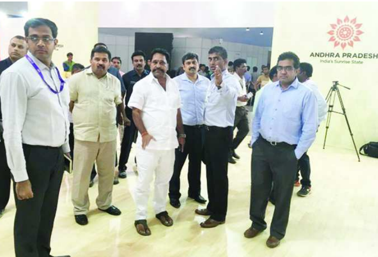
స్కార్ప్ సిటీ విశాఖలో మూడు రోజుల పాటు నిర్వహించనున్న భాగస్వామ్య సదస్సుకు ఏర్పాట్లను పరిశీలిస్తున్న మంత్రి అమర్నాథ్ రెడ్డి, జిల్లా అధికారులు