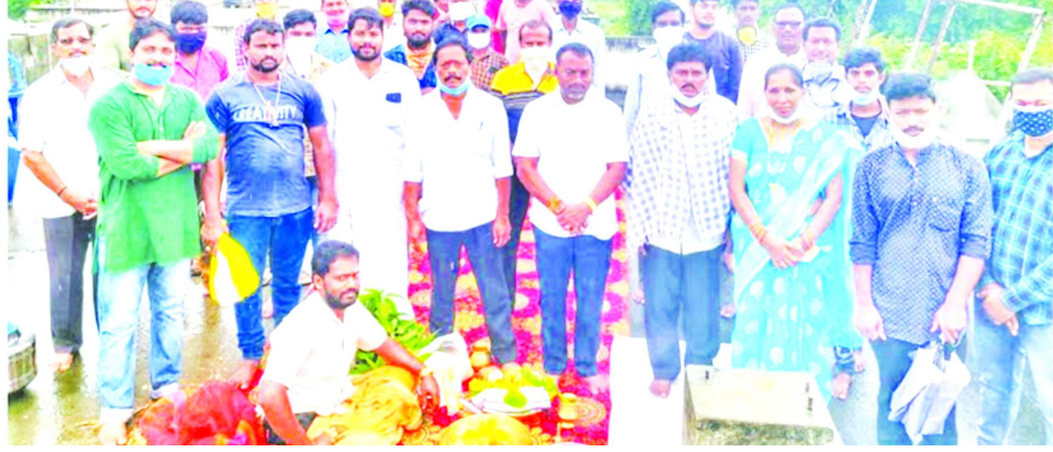
పరవడ : పెందుర్తి నియోజకవర్గం పరిధిలో ఉన్న 79వ వార్డు దేశపాత్రుని పాలెం గ్రామంలో జన సేనకు మరయు జనసేన పాలెం జనసేన పార్టీ నాయకులు, జనసేనకు తదితరులు పాల్గొన్నారు.