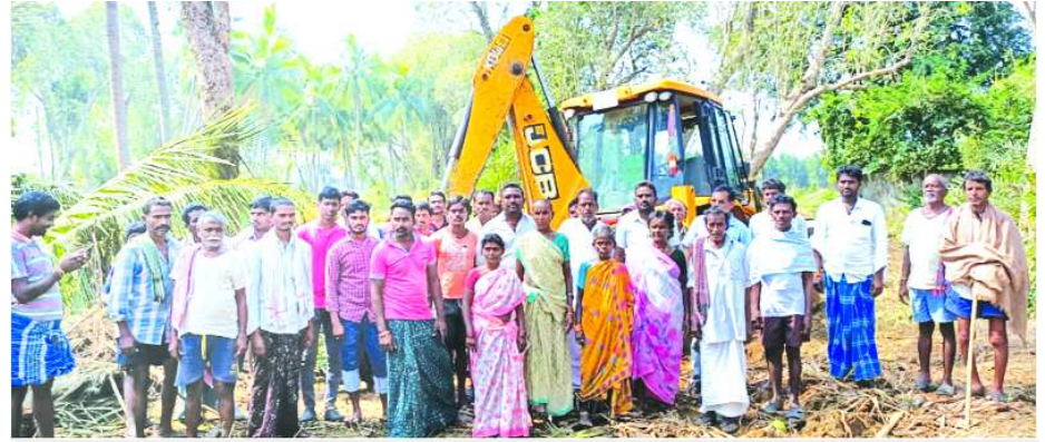
అందోళన చేస్తున్న గ్రామస్థులు

నర్సపట్నం : నర్సపట్నం మున్సిపాలిటీ పరిధిలో కృష్ణా పురం గ్రామంలో రెండు ఎకరాల 70 సెంట్ల మంద బైల భూములను ప్రభుత్వం స్వాధీనం చేసుకొని ఇళ్ల స్థలాలకు కేటాయించడంపై గ్రామస్థులు ఆగ్రహం వ్యక్తం చేస్తున్నారు. 664 నవ్వె నెంబర్ గల ఈ భూమి ప్రభుత్వంకు చెందినప్పటికీ కృష్ణాపురం గ్రామంలో ఉన్న గొల్లలు గొర్రెలకు కానుకు నేనుకు ఉన్న భూమిని ఉన్న పశం గా లాక్చేవడం సరికాదని, ఈ భూములు తాతల కాలం నుండి వస్తున్నాయని, అయి నప్పటికీ ఈ స్థలంలో ఉన్న కొబ్బరి చెట్లను నరకడం పై గ్రామస్థులు అధికారులను అడ్డుకున్నారు. సామాన్య ప్రజలు చెట్లను నరికితే వాల్టా యాక్ట్ కింద కేసు నమోదు చేసే రెవెన్యూ అధికారులు, ఫార్స్ట్ అధికారులు వాల్టా యాక్టును