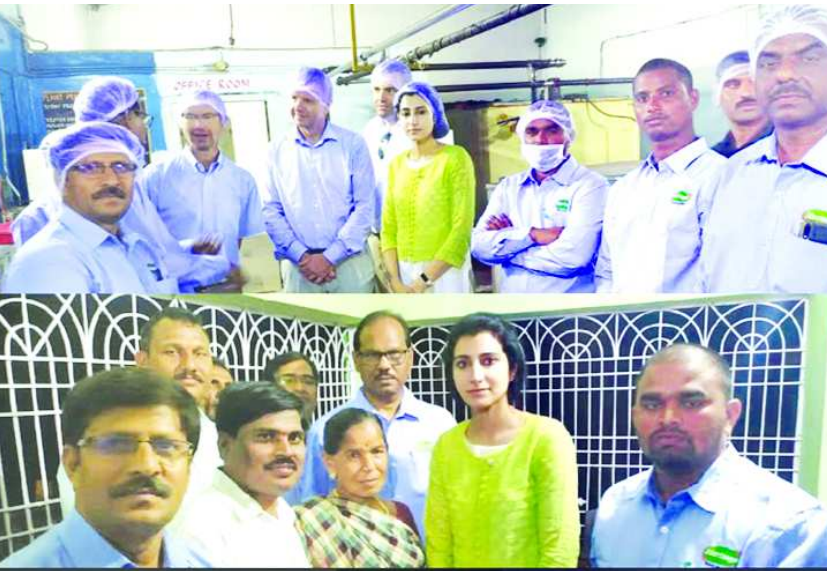
హెలిటెక్ డెయిరీ ఈడీ నారా బ్రాహ్మణి