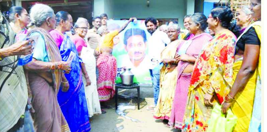
సంక్షేమం విలువ ఎంతో స్థానిక సంస్థల ఎన్నికలలో వైసీపీ అన్నిచోట్ల విజయభోగట్ల ఎగరవేసాక తెలుస్తుందన్నారు.