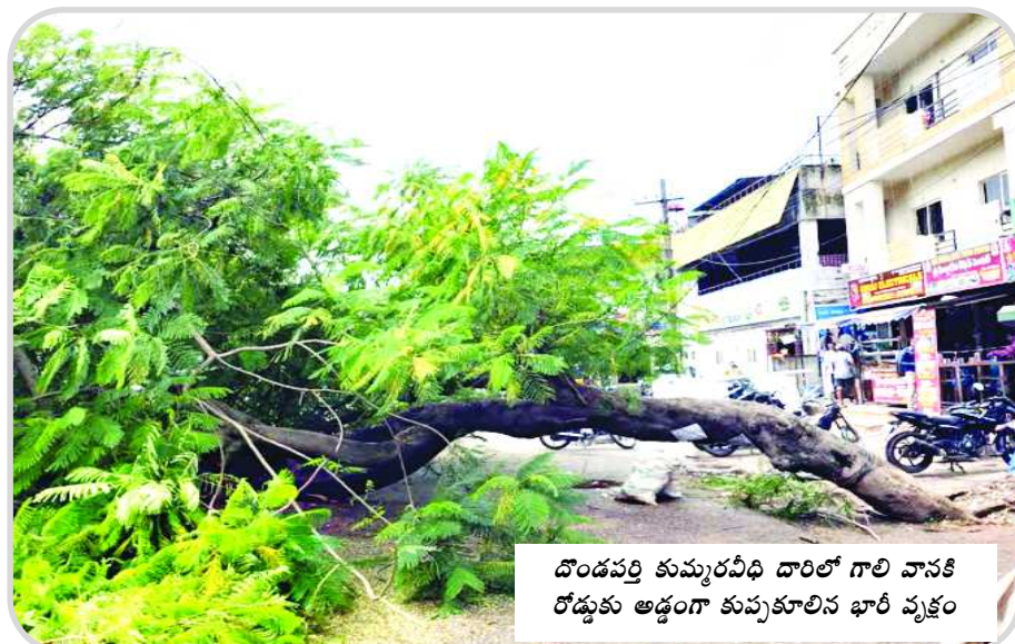
దొండపల్లి కుమరవేది దారిలో గాలి వాసికి రోడ్డుకు అడ్డంగా కుప్పకూలిన భారీ వృక్షం

లోకంపై స్టానాన్ని ఓ యూనిట్ గుర్తించి వాటిల్లో స్కూల్ డెవలప్ మెంట్ సెంటర్లను ఏర్పాటు చేస్తాం. అక్కడి విద్యార్థుల సామర్థ్యాన్ని బట్టి వారికి ట్రైనింగ్ ఇస్తాం. పరిశ్రమల యాజమాన్యాలే వారికి కావాల్సిన ఉద్యోగులను ఎంపిక చేసుకుంటాయి. ఆ విధంగా వారి ట్రైనింగ్ ఇస్తారు. స్కూల్ డెవలప్ మెంట్ సెంటర్లను ఇంకొక్కచోట సెంటర్ గా కూడా మారుస్తాం. ఇక్కడి నుంచి రాష్ట్రానికి కాకుండా దేశానికి కూడా ఐటీ సేవలను అందించే విధంగా ఆ సెంటర్లను తయారుచేస్తాం. ఉద్యోగాల కల్పనకు ఏటీ ప్రభుత్వం తీసుకోవాలి. గత ప్రభుత్వం చర్యల కారణంగా నిరుద్యోగం తీవ్ర స్థాయిలో పెరిగింది. పాదయాత్రలో ఇచ్చిన మాటలకు కట్టుబడి రెండు నెలల్లోనే 4 లక్షల ఉద్యోగాల నియామకానికి చర్యలు తీసుకున్నాం. గ్రామ వాలంటీర్ల కింద రెండు లక్షలకు పైగా ఉద్యోగాలను ఇప్పటికే నియమించాం. రానున్న రోజుల్లో మరికొన్ని ఉద్యోగాలు రాబోతున్నాయి. మన పిల్లల మీద పూర్తిస్థాయి నమ్మకంతోనే 75 శాతం ఉద్యోగాలు స్థానికులకే కల్పించే విధంగా ఆసెంబ్లీలో చట్టం తీసుకువచ్చాం. దేశ చరిత్రలోనే ఈ విధంగా చట్టం తీసుకురావడం తొలిసారి. ఇతర రాష్ట్రాల ఉద్యోగులతో మన విద్యార్థులు ఐటీ పదాలి. ట్రీపుల్ ఐటీల ద్వారా అనేక ఉద్యోగాలను సృష్టించబోతున్నాం. ప్రతి జనపరిలో ఉద్యోగాల క్యాలెండర్ ను విడుదల చేస్తాం. ఏదాదిలో ఏర్పడిన ఖాళీలను ఆదీ ఏదాదిలో పూర్తి చేస్తాం. పాదయాత్ర నుంచి వచ్చిన ఆలోచనలే ఈ ప్రజాపథకాలు