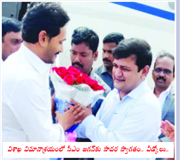
విశాఖ విమానాశ్రయంలో సీఎం జగన్కు సాదర స్వాగతం.. ఏదోయి..

పలాస/శ్రీకాకుళం : కిడ్నీ వ్యాధి బాధితులకు స్టేట్-3 నుంచి పెన్షన్ అమలు చేస్తామని ముఖ్యమంత్రి వైఎస్ జగన్మోహన్ రెడ్డి తెలిపారు. ప్రస్తుతం స్టేట్-5లో డయాలసిస్ పేషెంట్లకు ఇస్తున్న రూ. 10 వేల పెన్షన్తో పాటు, స్టేట్-3లో ఉన్న వారికి కూడా రూ. 5 వేల పెన్షన్ అందజేస్తామని పేర్కొన్నారు. అదే విధంగా డయాలసిస్ పేషెంట్లకు సహాయంగా ఉండేందుకు హెల్త్ వర్కర్లను నియమిస్తామని, బాధితులతో పాటు వారికి కూడా ఉచిత బస్సు పాసులు అందజేస్తామని హామీ ఇచ్చారు. ఉద్ధానం కిడ్నీ బాధితులను ఆదుకునేందుకు పలాసలో నిర్మించనున్న 200 పడకల కిడ్నీ సూపర్