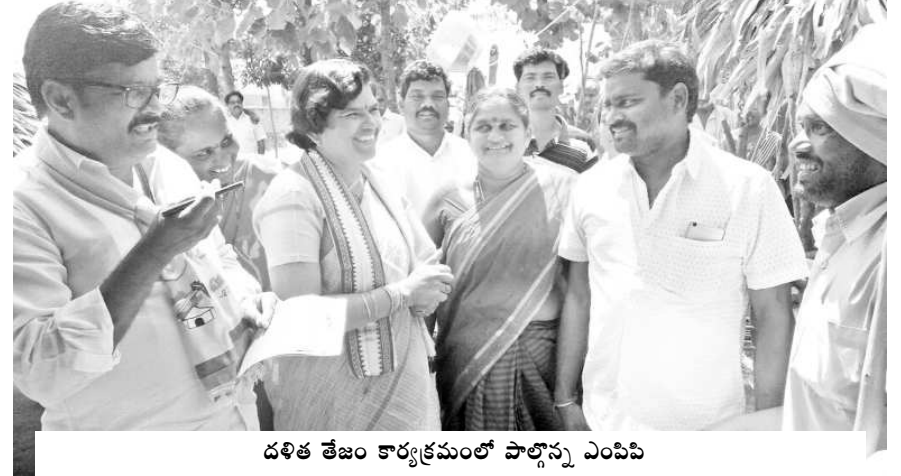
దళిత తేజం కార్యక్రమంలో పాల్గొన్న ఎంపీపీ

నర్సపట్నం : నర్సపట్నం మండలం నీలంపేట గ్రామంలో చంద్రన్న దళిత తేజం కార్యక్రమాన్ని నిర్వహించారు. ఈ సందర్భంగా దళిత వాడల్లో తిరుగుతూ వారి సమస్యలను తెలుసుకున్నారు. ఈ సందర్భంగా ఎంపీపీ మాట్లాడుతూ దళితుల సమస్యలు, అవసరాలను తెలుసుకొని వాటిని తీర్చేందుకే ఈ కార్యక్రమం ఉద్దేశ్యమన్నారు. ఈ కార్యక్రమంలో మండలం నీలంపేట గ్రామంలో చంద్రన్న దళిత తేజం కార్యక్రమాన్ని నిర్వహించారు. ఈ సందర్భంగా దళిత వాడల్లో తిరుగుతూ వారి సమస్యలను తెలుసుకున్నారు. ఈ సందర్భంగా ఎంపీపీ మాట్లాడుతూ దళితుల సమస్యలు, అవసరాలను తెలుసుకొని వాటిని తీర్చేందుకే ఈ కార్యక్రమం ఉద్దేశ్యమన్నారు.