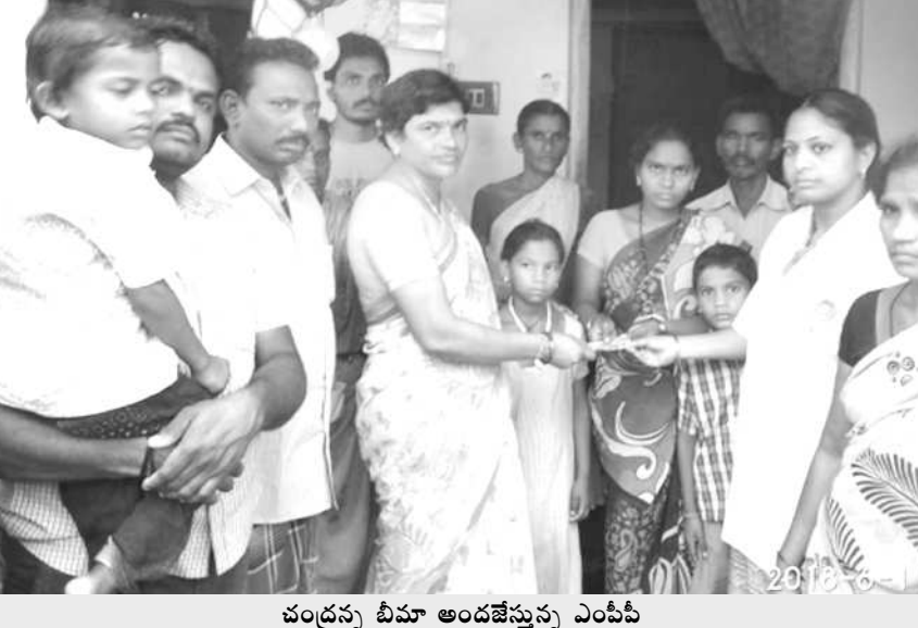
చంద్రన్న భీమా అందజేస్తున్న ఎంపిపి