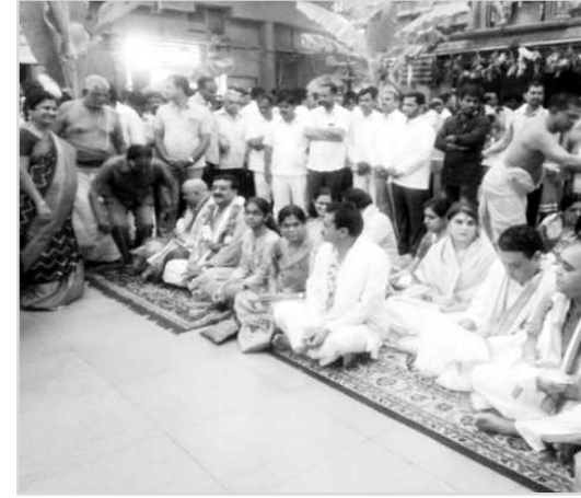
యాదాద్రి : యాదగిరిగుట్ట పై కొలువుదీరిన శ్రీ లక్ష్మీనరసింహ స్వామిని 12 మంది సీనియర్ ఐపీఎస్ అధికారులు దర్శించుకున్నారు. కుటుంబ సభ్యులతో కలిసి స్వామివారిని దర్శించుకొని ప్రత్యేక పూజలు నిర్వహించారు. అనంతరం ఆలయ అభివృద్ధి పనులను పరిశీలించారు. ఆదివారం కావడంతో యాదాద్రికి భక్తుల తాడి పెరిగింది. ప్రస్తుతం స్వామివారి ధర్మ దర్శనానికి 5 గంటల సమయం, ప్రత్యేక ప్రవేశ దర్శనానికి గంటన్నర సమయం పడుతోంది. భక్తుల రద్దీ దృష్ట్యా వాహనాలను గుట్టపైకి అనుమతించడం లేదు.